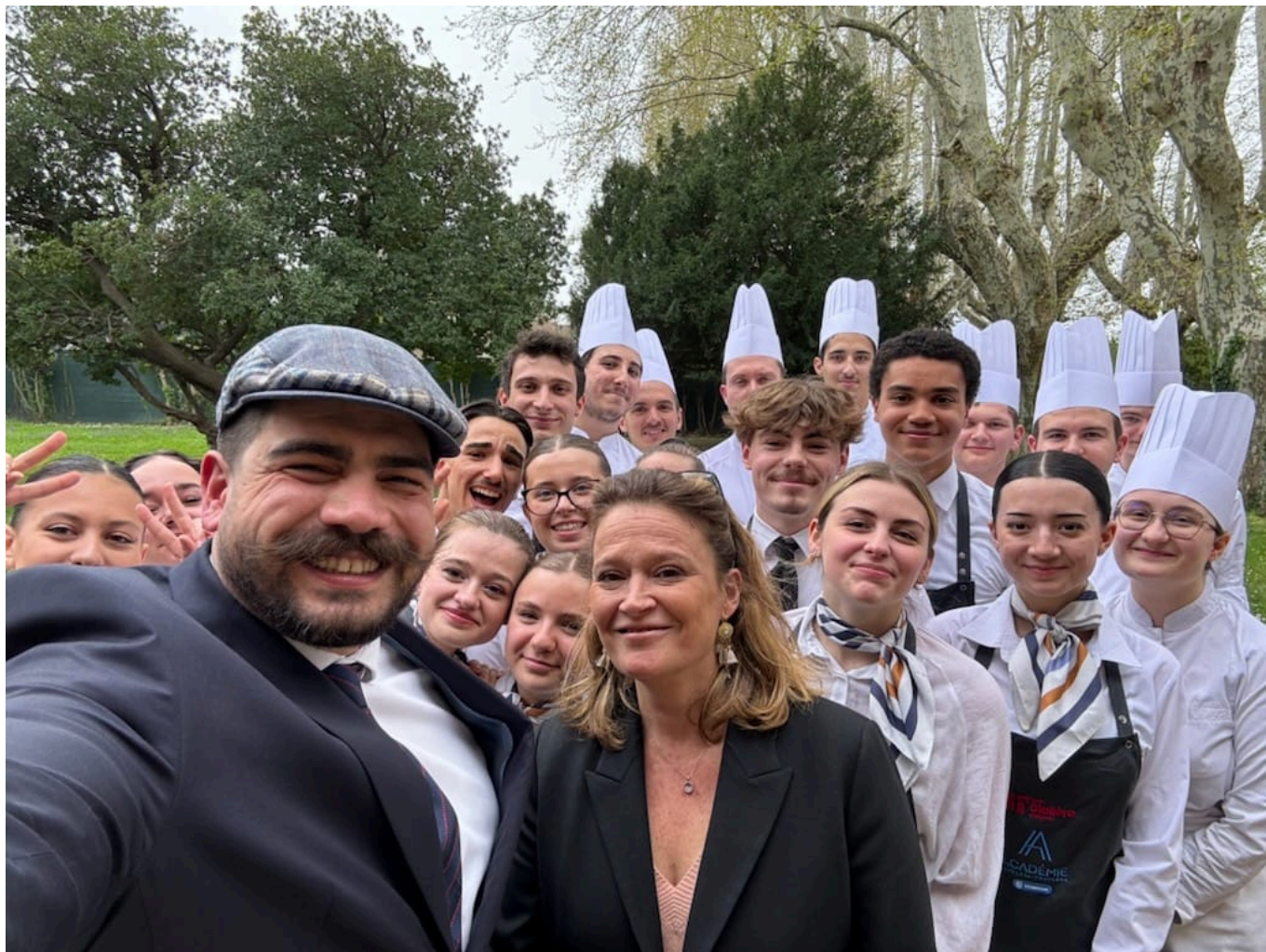
Les deux ministres aux côtés des apprentis de l'école hôtelière d'Avignon.