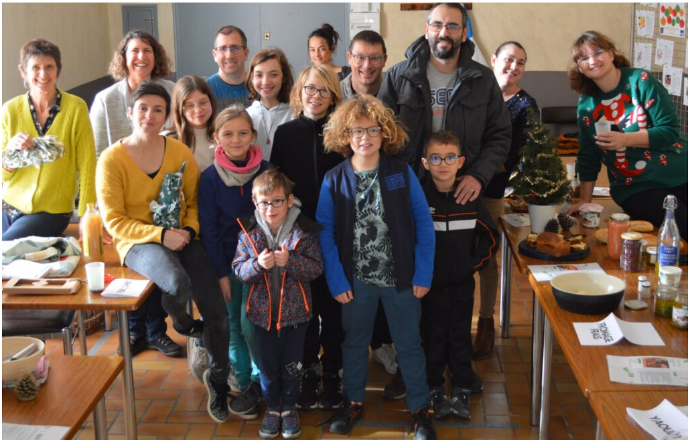
Les familles zéro déchets