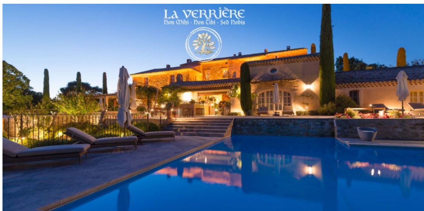
Le crépuscule des Dieux. @La Verrière

Sa posture de leader laisse une empreinte indélébile. Arrive la traditionnelle séance photo, il dirige, oriente la prise de vue. Mais il se résout très vite à adopter votre œil de photographe et vous laisse prendre la main. Ce qui vous marque ? Un verbe empreint de spiritualité et d'énergie positive. Le pont navigue entre les croyances ancrées du Moyen Âge, le taureau Vintur, Dieu du mal qui récolte les sacrifices humains (à l'origine du Mont Ventoux), la déesse Vaison et toute la symbolique de fertilité autour de la nature. Installé confortablement, son regard au loin se laisse transporter, animé d'une sagesse réconfortante. L'aura émanant de l'ancienne bastide du XVIII e est mystique.