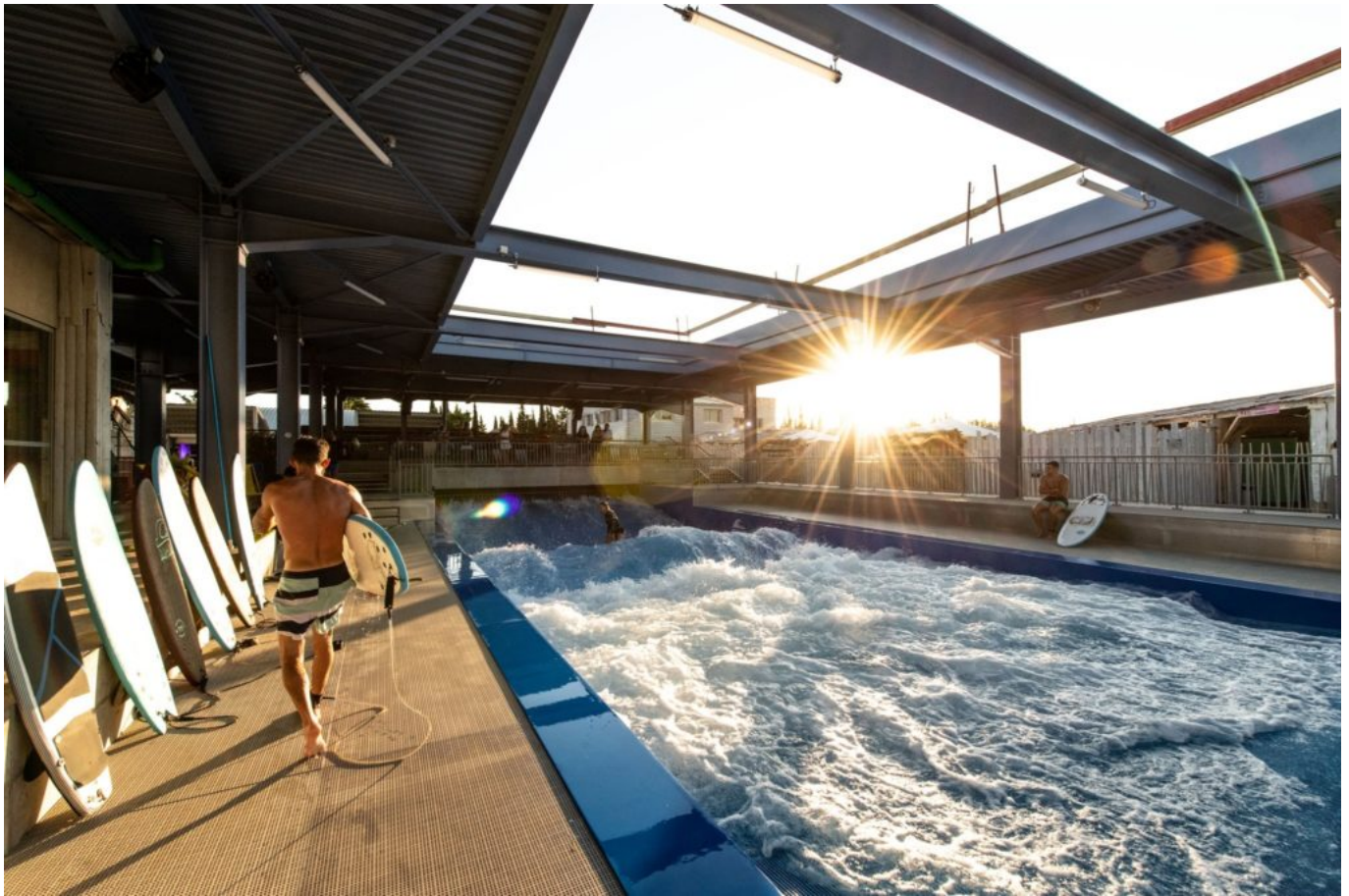
'My surf city wave' pour les amateurs de glisse !

Partez à la découverte des attractions au sein de l'univers rafraîchissant du parc aquatique. Wave island compte aujourd'hui 23 attractions et activités aquatiques, comprenant des toboggans aquatiques, des vagues artificielles, des coins de détente et d'autres activités ludiques promettant des moments de fun et de détente pour toute la famille. Petits et grands, en quête d'évasion ou amateurs de sensations fortes, tout le monde trouve son bonheur. Le parc aquatique est ouvert jusqu'au 31 août 2021.