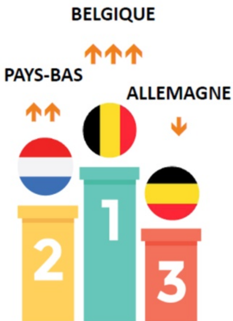
TOP ORIGINES ÉTRANGÈRES ESTIVALES