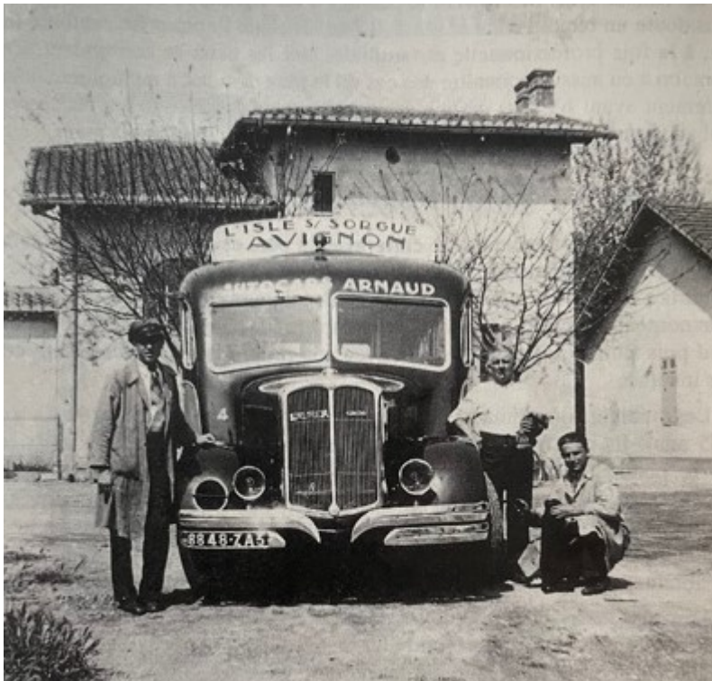
Les Autocars Arnaud à l'Isle-sur-la-Sorgue en 1938.

En tout l'entreprise totalise 150 véhicules dont une quinzaine dédiée aux transports de proximité. On voit ainsi des bus Arnaud qui irriguent les transports urbains de Sorgues, Châteaurenard et dans les agglomérations du Grand Avignon et de Carpentras (Cove).