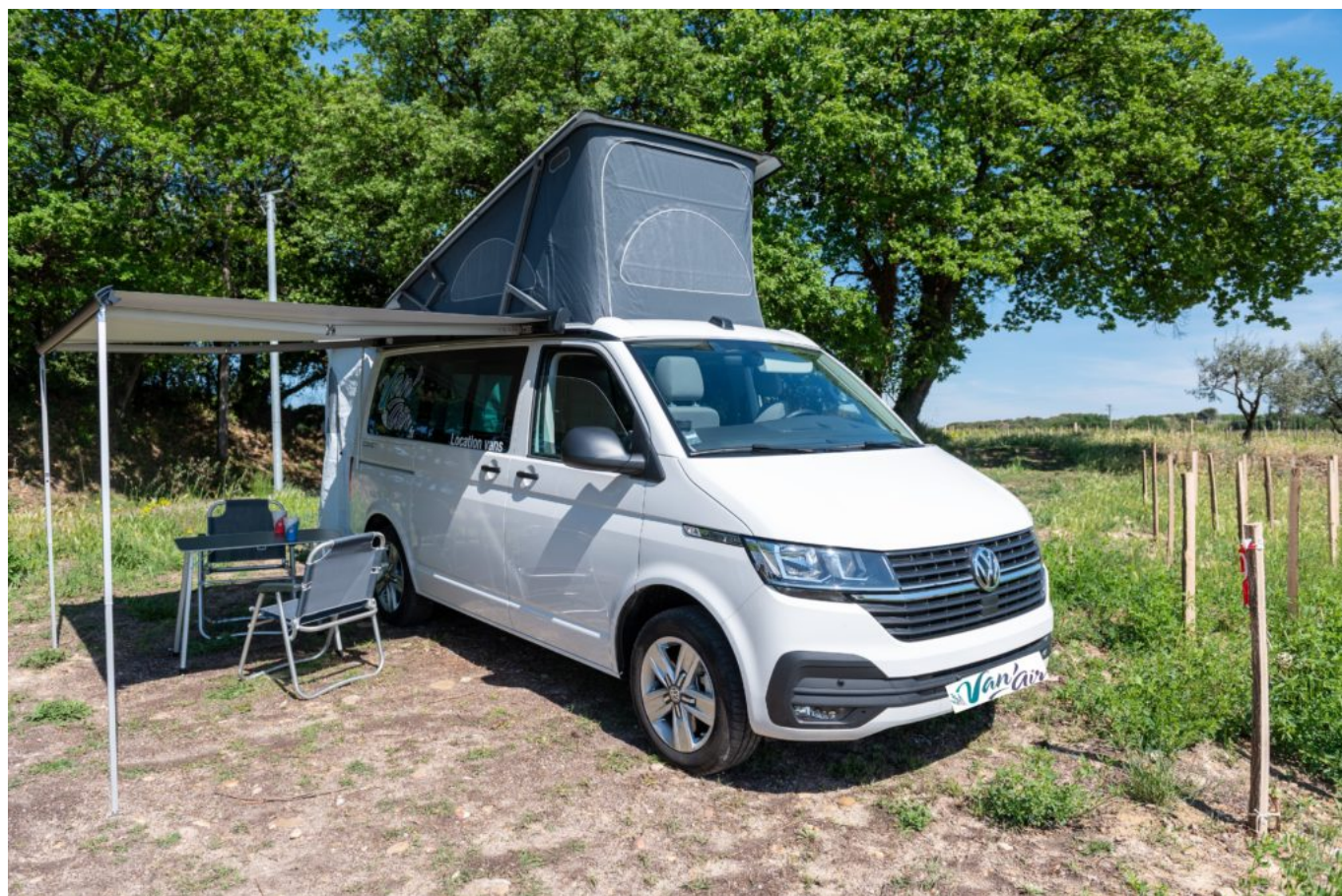
Le 'California' avec le toit relevable.