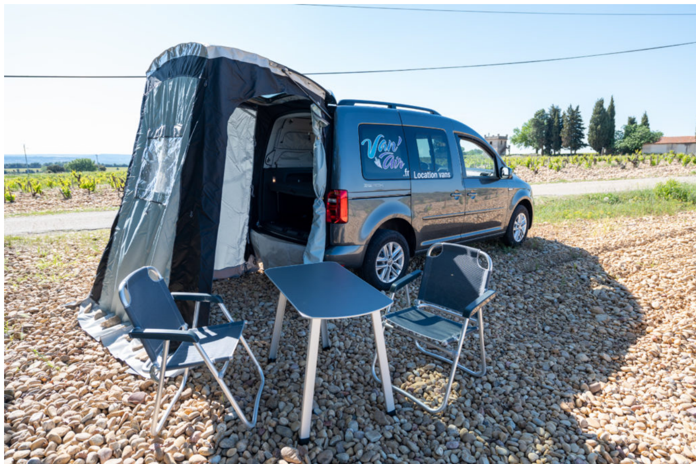
Le Caddy Beach avec une tente de hayon.