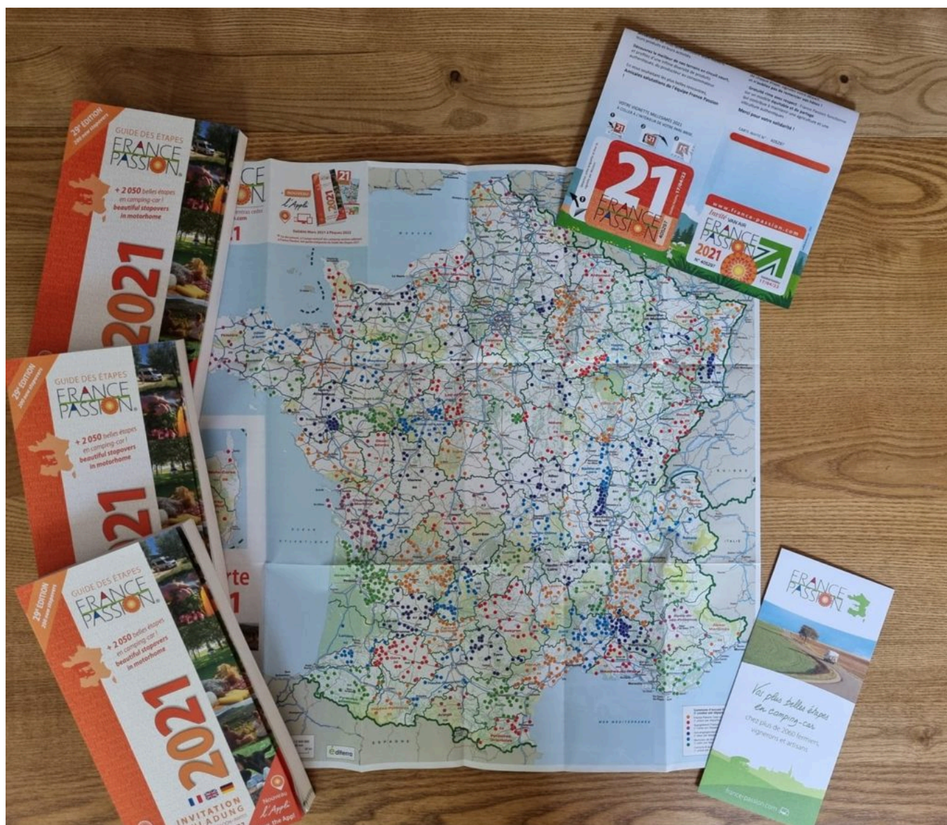
Les livrets France Passion.

bon voyageur, permet de dormir gratuitement chez les agriculteurs locaux se trouvant sur son parcours. Plus de 200 adresses sont répertoriées, dans des lieux d'accueil aussi authentiques qu'atypiques. En 1997, suite à un accord avec les Chambres d'agriculture et 'Bienvenue à la ferme', des producteurs de fromages, de miel, de fruits, ont rejoint le réseau aux côtés des vigneronns. A noter, la consommation et tout achat au sein d'un établissement est à la charge du client. L'entrepreneuse a ainsi découvert foultitude d'endroits magiques lors de ses balades ainsi que des produits du terroir méconnus, qu'elle souhaite faire découvrir à sa clientèle.