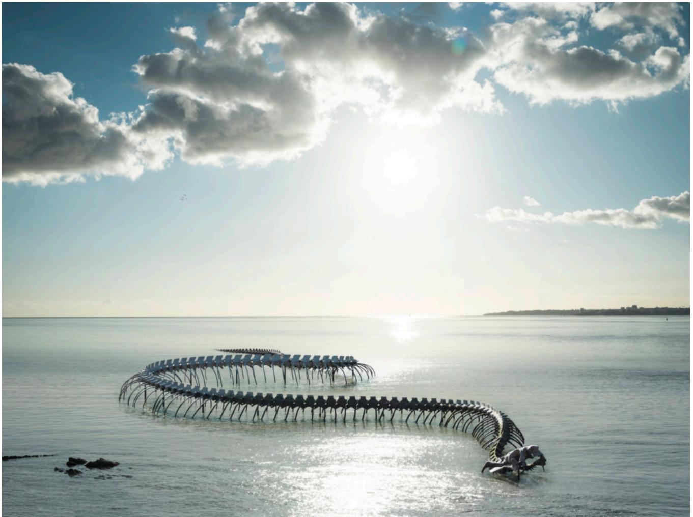
Le serpent d'océan, par Huang Yong Ping, à Saint Brévin.