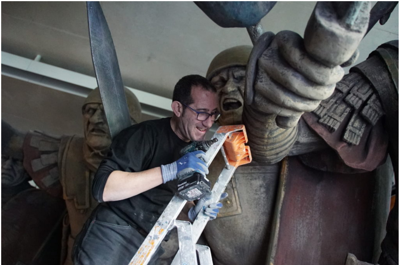
Démontage Galerie Combats

C'était le mercredi 9 décembre de l'an 2020, un combat titanesque se jouait pour la dernière fois au premier étage du MuséoParc Alésia sur les terres d'Alise-Sainte-Reine, en Côte-d'Or. Des colosses de plus de trois mètres figés dans des grimaces plus belliqueuses les uns que les autres se voyaient inexorablement choir de leur piédestal, attaqués par d'improbables soldats lilliputiens dépourvus de toutes armures. Ces envahisseurs qui mettaient ainsi fin à l'affrontement de guerriers romains et gaulois, pétrifiés depuis plus de huit ans dans un simulacre, criant de réalisme, d'un épisode parmi les plus célèbres de La guerre des Gaules, n'étaient autres que les maîtres des lieux : les équipes du MuseoParc Alésia, sous la direction de Michel Rouger. Créée en 2012, la fameuse galerie des combats, était emblématique du site : elle surprenait le visiteur dès l'entrée de l'exposition permanente. La rencontre avec ces statues géantes permettait de saisir d'un coup la force de l'affrontement, tout en apportant beaucoup d'informations sur les équipements au combat.