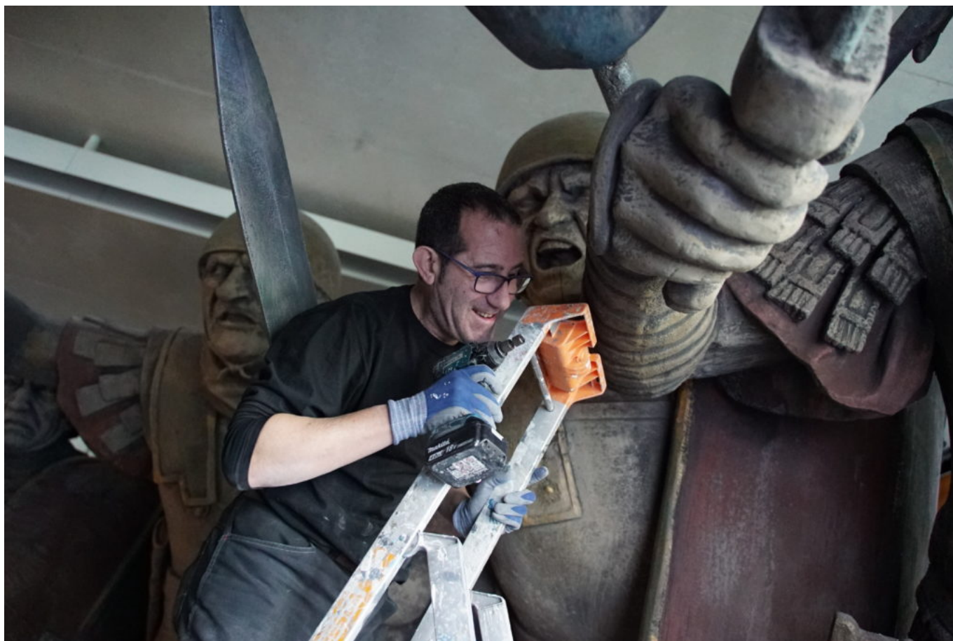
Démontage Galerie Combats

C'était le mercredi 9 décembre de l'an 2020, un combat titanesque se jouait pour la dernière fois au premier étage du MuséoParc Alésia sur les terres d'Alise-Sainte-Reine, en Côte-d'Or. Des colosses de plus de trois mètres figés dans des grimaces plus belliqueuses les uns que les autres se voyaient inexorablement choir de leur piédestal, attaqués par d'improbables soldats lilliputiens dépourvus de toutes armures. Ces envahisseurs qui mettaient ainsi fin à l'affrontement de guerriers romains et gaulois, pétrifiés depuis plus de huit ans dans un simulacre, criant de réalisme, d'un épisode parmi les plus célèbres de La guerre des Gaules, n'étaient autres que les maîtres des lieux : les équipes du MuseoParc Alésia, sous la direction de Michel Rouger. Créée en 2012, la fameuse galerie des combats, était emblématique du site : elle surprenait le visiteur dès l'entrée de l'exposition permanente. La rencontre avec ces statues géantes permettait de saisir d'un coup la force de l'affrontement, tout en apportant beaucoup d'informations sur les équipements au combat.