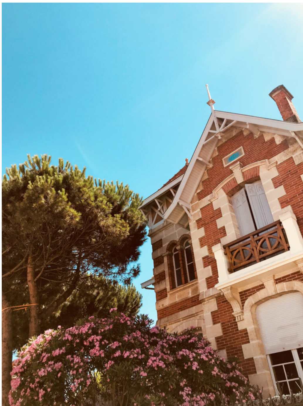
Villa Soulac