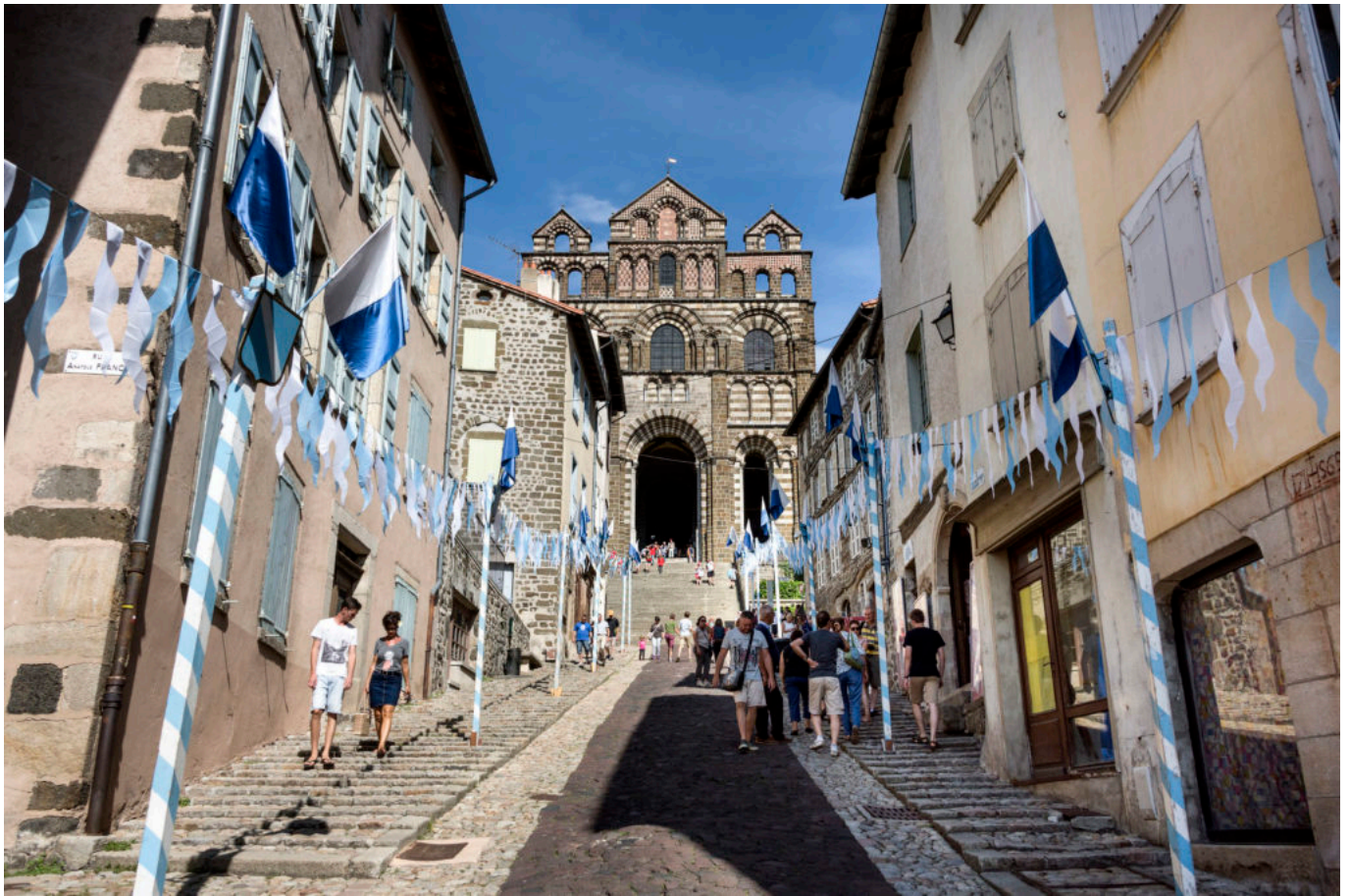
La cathédrale Notre-Dame-du-Puy-en-Velay