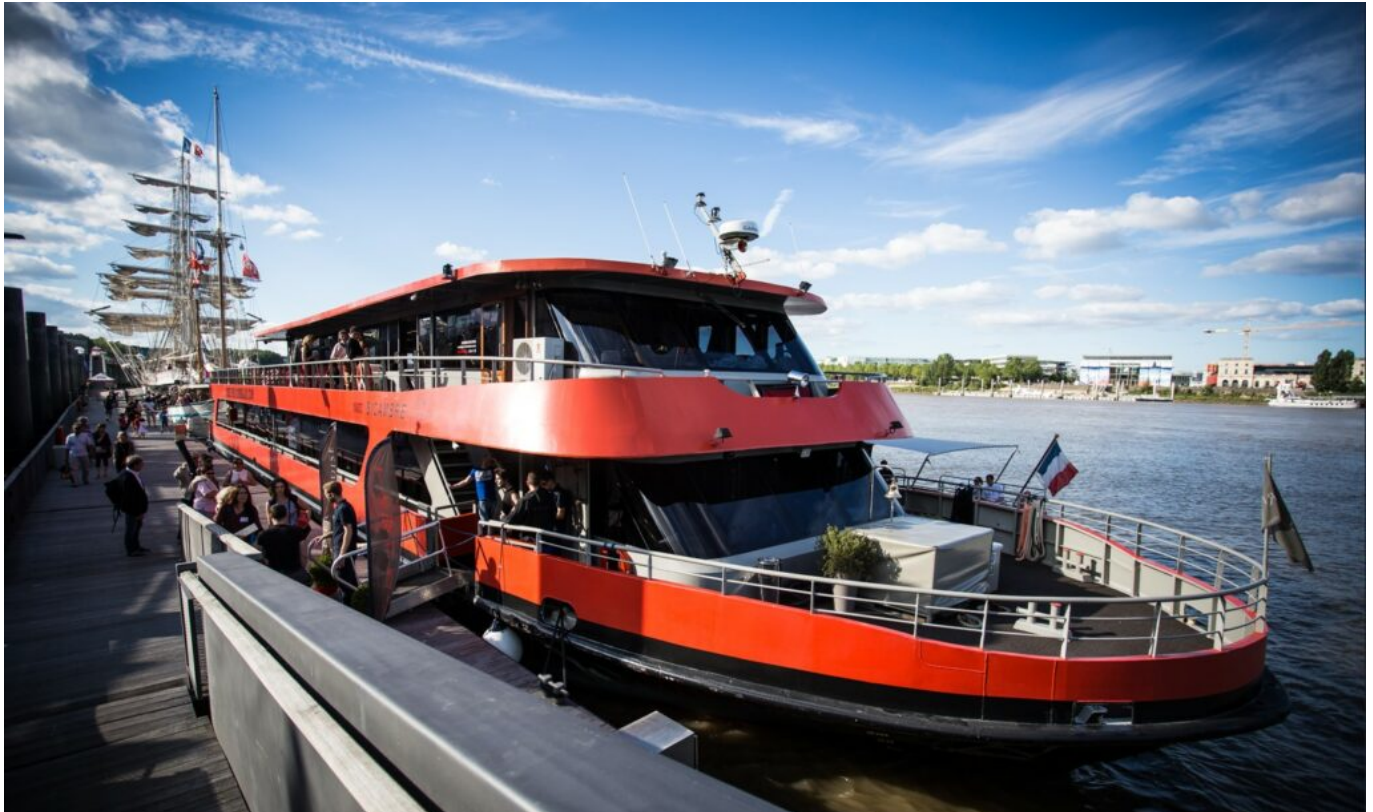
Le Sicambre à Bordeaux