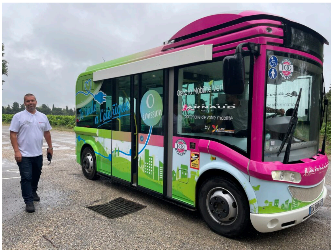
Navette électrique © Andrée Brunetti

En quelques chiffres, la double activité transports / agence de voyage de cette entreprise centenaire, ce sont 160 collaborateurs, 4 millions de kilomètres parcourus, un chiffre d'affaires de 12,5M€, 3 millions et demi de voyageurs transportés par an. 3 500 élèves, écoliers, collégiens, lycéens par jour, des lignes régionales, avec des véhicules récents, sûrs, bien entretenus, confortables et accessibles aux handicapés. Principales destinations : vers l'Espagne, l'Italie, la Croatie, la Principauté d'Andorre. Avec les agences de l'Isle sur la Sorgue et Carpentras, sont organisés des voyages clés en main pour les groupes, les associations, les CE, avec un programme culturel, des visites de sites historiques, un itinéraire au cas par cas. Mais aussi des billetteries air-mer-chemins de fer. Arnaud Voyages propose aussi la location de véhicules pour 4 à 78 places, avec ou sans chauffeur, des navettes VIP pour « voyageurs d'affaires ».