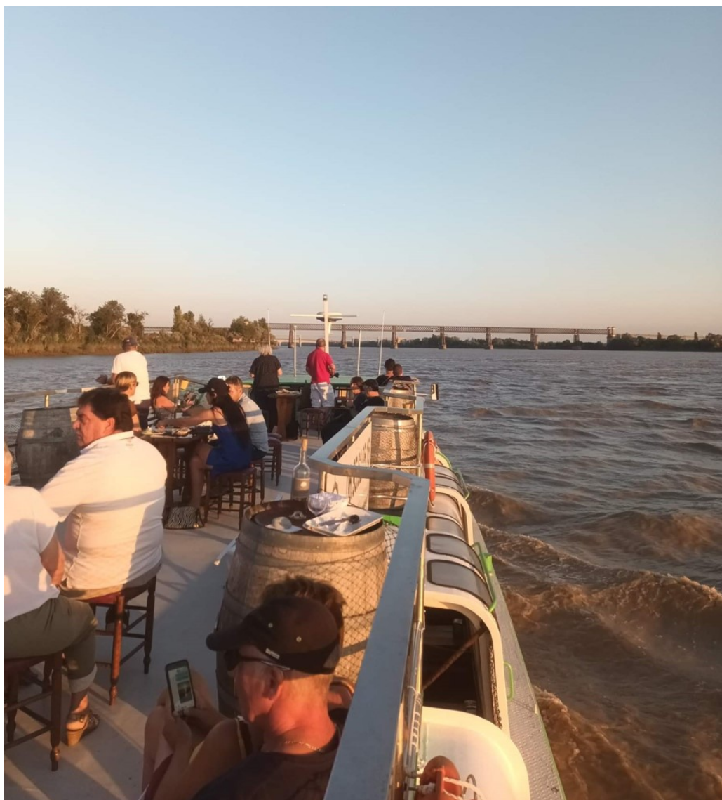
L'hermine en Navigation

gastronomique, œnologique, architectural, naturel ou historique. Chez Presqu'île Croisière, la plupart des offres s'organisent sur des plages allant de 2 heures à 2h30, avec des dégustations de produits du terroir et de vins locaux, sur des thèmes divers : Découverte (du patrimoine), Clair de lune (le soir) Vigneronne (avec un vigneron à bord) Mascaret (où l'on surfe sur la vague à date précise) ou encore Moussaillon (pédagogique et ludique). Les Bateaux Bordelais sont, eux, la seule compagnie qui propose une restauration à bord d'un de ses bateaux, le Sicambre, qui compte une cuisine et sa brigade, et un vaste restaurant pouvant accueillir 150 convives (et 250 en cocktail). Déjeuner ou dîner croisière se dégustent en 3 plats et 2 heures 30 de navigation.