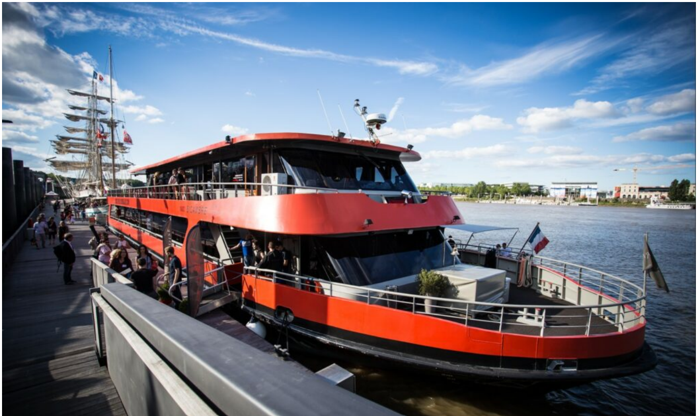
Le Sicambre à Bordeaux