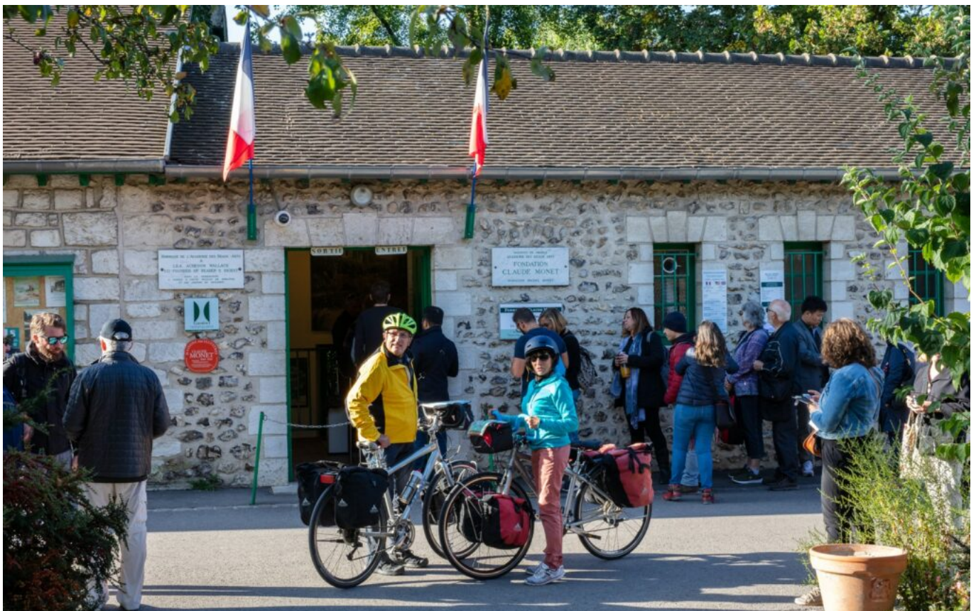
Les cyclistes roulent sur les traces de Claude Monet avec Giverny comme point d'étape.

Des paysages que les quinze territoires engagés dans cette démarche veulent mettre en avant pour faire rayonner le patrimoine culturel, naturel, historique ou encore industriel de la vallée de la Seine. Et ça fonctionne : la Seine à vélo a été récemment classée parmi les 25 destinations incontournables en 2022 par National Geographic et figure dans les 52 destinations à visiter en 2022 par New York Times.