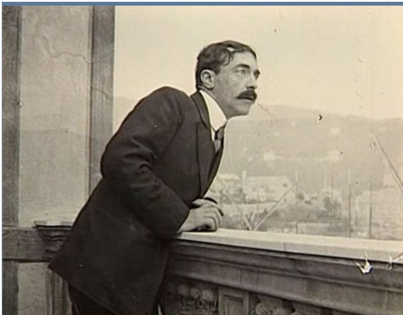
Paul Valéry