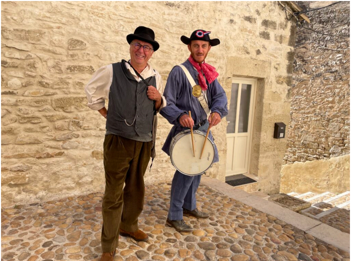
Un Anglois du siècle dernier et le garde-champêtre du village

En cette journée du 2 août 1914, quatre femmes se retrouvent au Lavoir pour la corvée du linge. L'occasion de parler de tout et surtout de leurs conditions de vie de femme et d'employée. Chacune possède un caractère bien trempé, ses douleurs, ses joies, ses rêves et ses désillusions. Toutes sont bavardes, entières et explosives. Disputes, réconciliations, complicité, les fous rires rythment cette journée ordinaire du début du 20 e siècle qui finira par bouleverser le monde entier. Car personne ne se doute que cette journée va faire basculer leur destin avec la déclaration de ce que l'on nommera, plus tard, la Grande Guerre. Quatre beaux portraits de femmes, servis par un texte vif et poétique, un vrai régal pour les comédiennes comme pour les spectateurs. La mise en scène est de Bertrand Beillot et le régisseur est Christian Rollot.