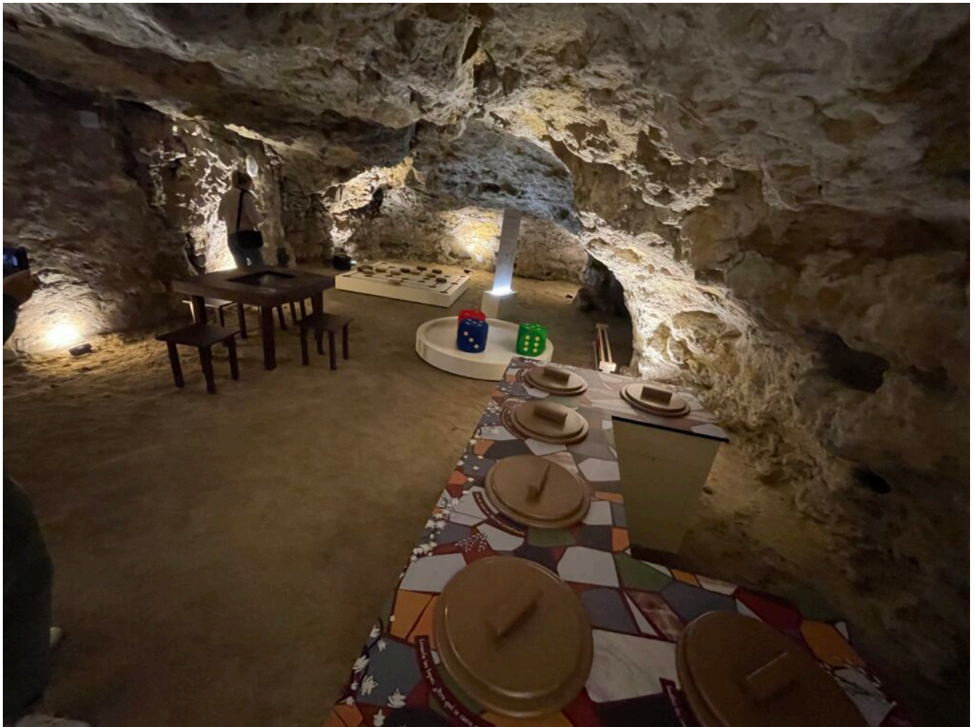
Se restaurer, jouer... en famille entre amis

La salle fait la part belle au génie romain reconnu dans le domaine, au combien essentiel, de l'hydraulique. Aménagement des territoires, approvisionnement en eau, aqueducs, thermalisme, les ingénieurs romains ont fait partie des maitres fondateurs de l'empire. Maquette tactile et animations nous permettent d'approcher ces génies-trouve-tout : avec eux, on expérimente, on observe, on comprend l'innovation.