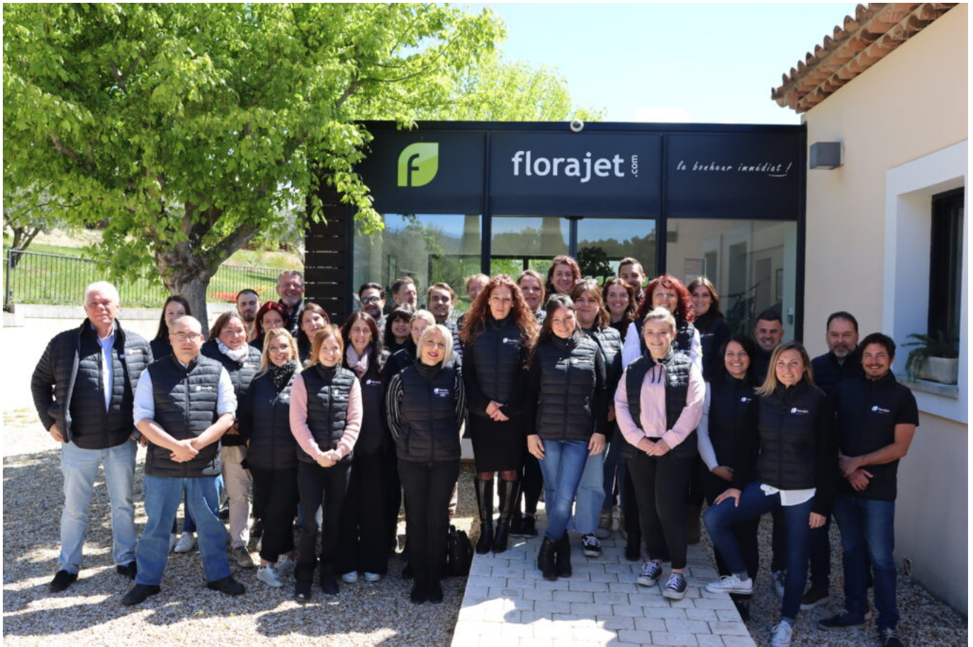
L'équipe de Florajet à Cabrières d'Aigues.

*Étude réalisée par Florajet en collaboration avec Opinionway auprès d'un échantillon de 1 048 personnes représentatif de la population Française âgée de 18 ans et plus, du 3 au 6 mai 2024. Opinionway a réalisé cette enquête en appliquant les procédures et règles de la norme ISO 20252