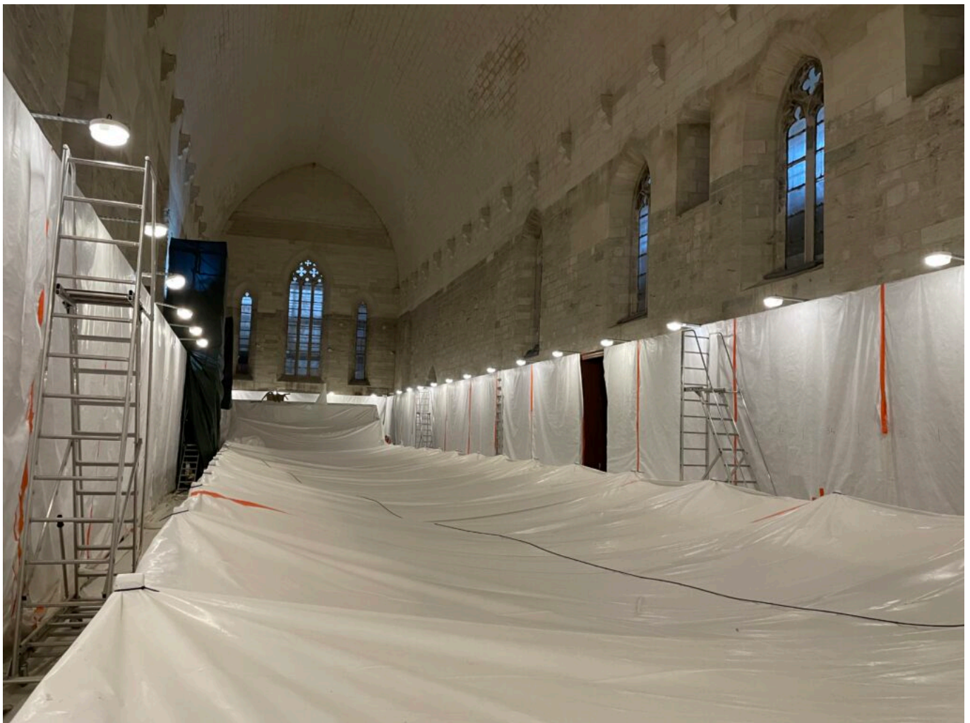
La Chapelle Benoit XII entièrement bâchée