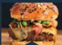
LE SOLEIL LEVANT Sandrine COLLONGE Cheffe de cuisine Sandrine Events (06110)