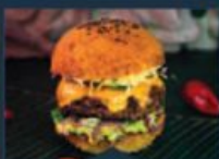
LE CRACK Timothée CLAVIER Chef de cuisine La Rôtisserie (91800)