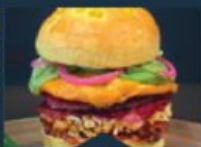
EL PÉPÉ Billy ANDRÉ chef de cuisine L'Atelier des Halles (85000)