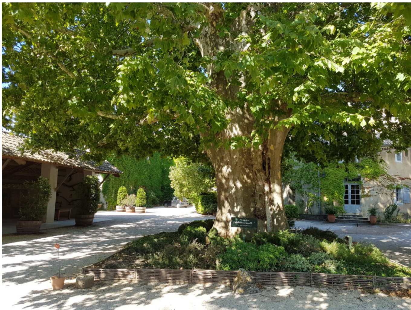
Le fameux platane classé « arbre remarquable. »