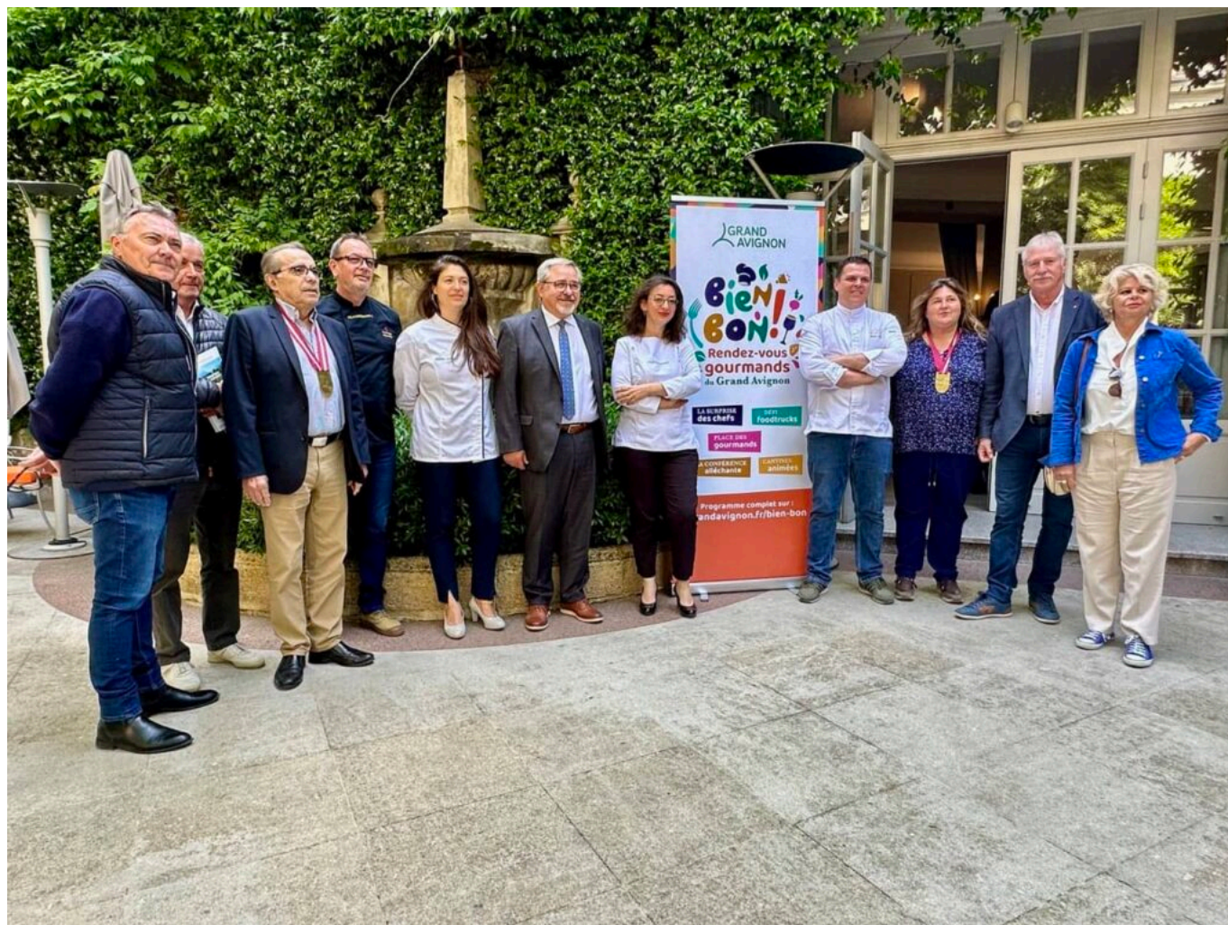
Les acteurs de 'Bien Bon !' lors de la présentation de l'événement.