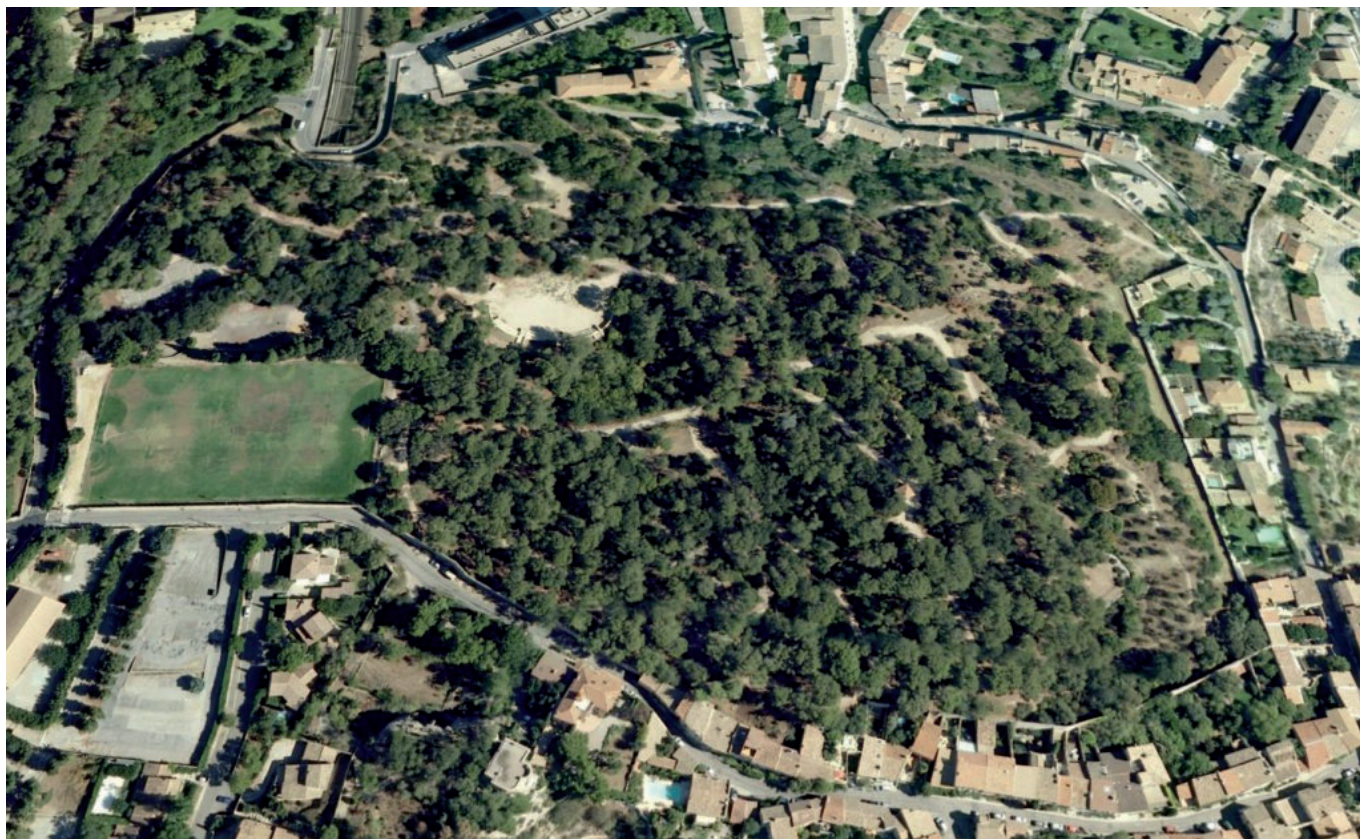
La colline des Mourgues : 7ha de forêt en plein coeur de ville.

A noter qu'une dérogation exceptionnelle est faite pour la représentation du ballet de l'Opéra Grand Avignon qui se produira avec 'L'art d'aimer' , le jeudi 23 juin à 20h15 dans le théâtre de verdure de la colline.