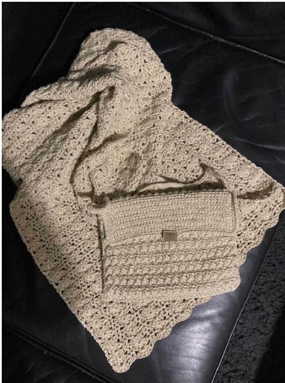
Sac et étole réalisés au crochet