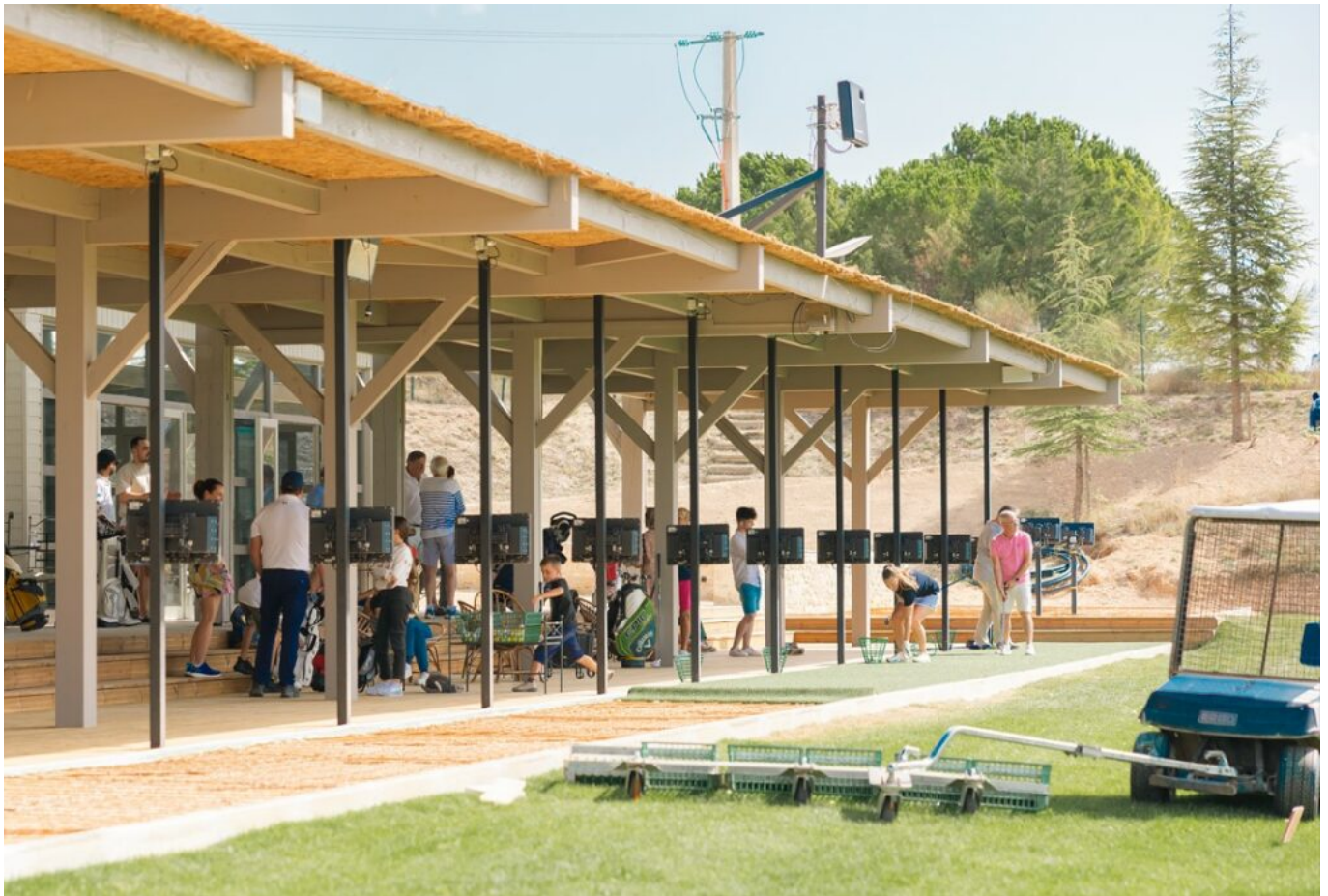
Le practice.

« Nous accompagnons tous les niveaux pendant 1h30 de cours les mercredis et les samedis, hors vacances scolaires, expliquent les responsables du golf des Ogres. Passage des drapeaux, compétition de classement trimestrielle, apprentissage avec les technologies Trackman et Lemerle, prêt du matériel : les golfeurs en herbe progressent et s'épanouissent dans un cadre verdoyant. »