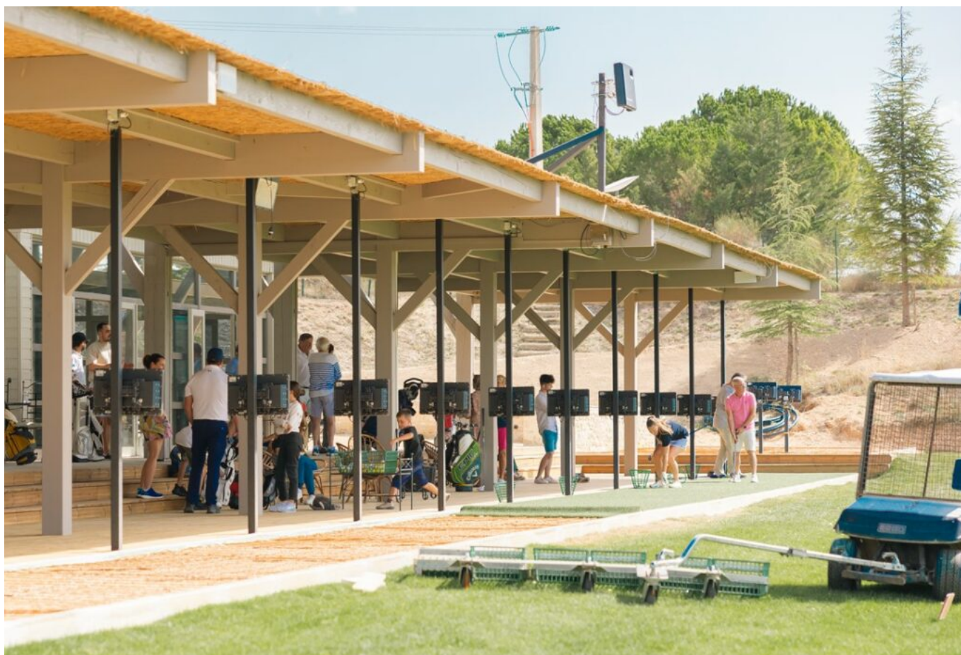
Le practice.

« Nous accompagnons tous les niveaux pendant 1h30 de cours les mercredis et les samedis, hors vacances scolaires, expliquent les responsables du golf des Ogres. Passage des drapeaux, compétition de classement trimestrielle, apprentissage avec les technologies Trackman et Lemerle, prêt du matériel : les golfeurs en herbe progressent et s'épanouissent dans un cadre verdoyant. »