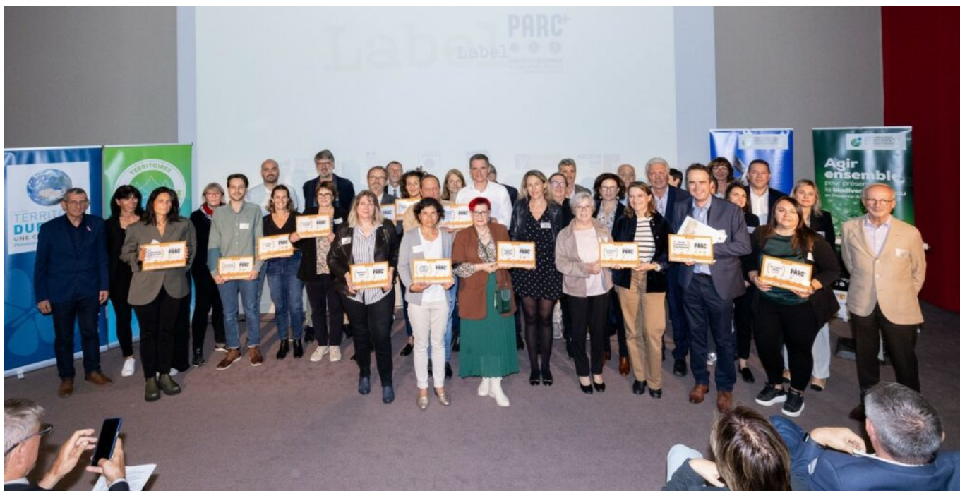
Les lauréats du label+.