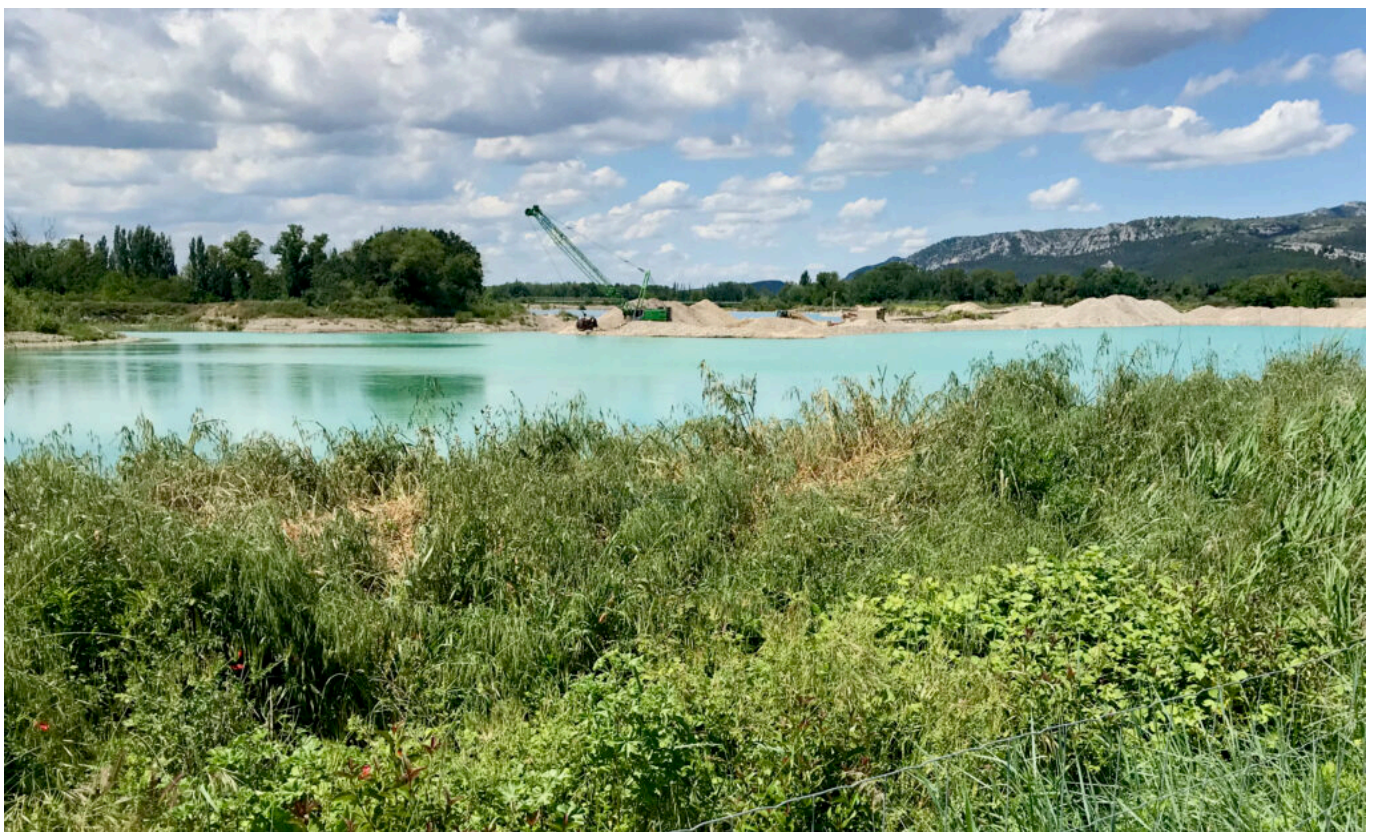
Gravières de Mallemort

L'agence de développement économique Vaucluse Provence Attractivité accompagne la ville de Cheval Blanc dans ce projet qui ressemble, il faut bien le dire, à une course à obstacles.