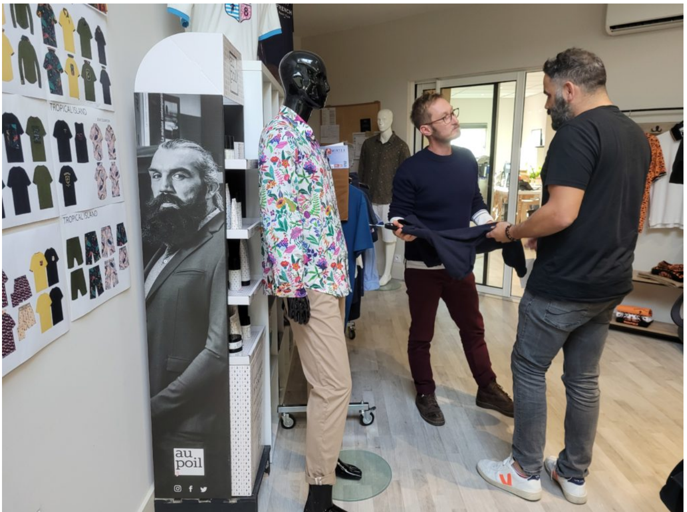
Session brainstorming en atelier.

Une pile électrique, pas de vacances, des « capsules » (nouvelles idées) qui jaillissent toutes les demi-heures. « Si la marque en est là aujourd'hui, c'est grâce à l'équipe. Je les remercie de me suivre, sans eux, on ne fait rien. Ce sont de gros travailleurs », dit-il avec fierté. Au-delà du travail, l'ambiance est conviviale et solidaire. Des selfies, des anniversaires, des blagues à tout va. Et d'abonder : « Je ne veux pas entendre qu'un salarié à la boule au ventre, le bien-être est primordial. Ici, pas de strates et une communication essentielle. »