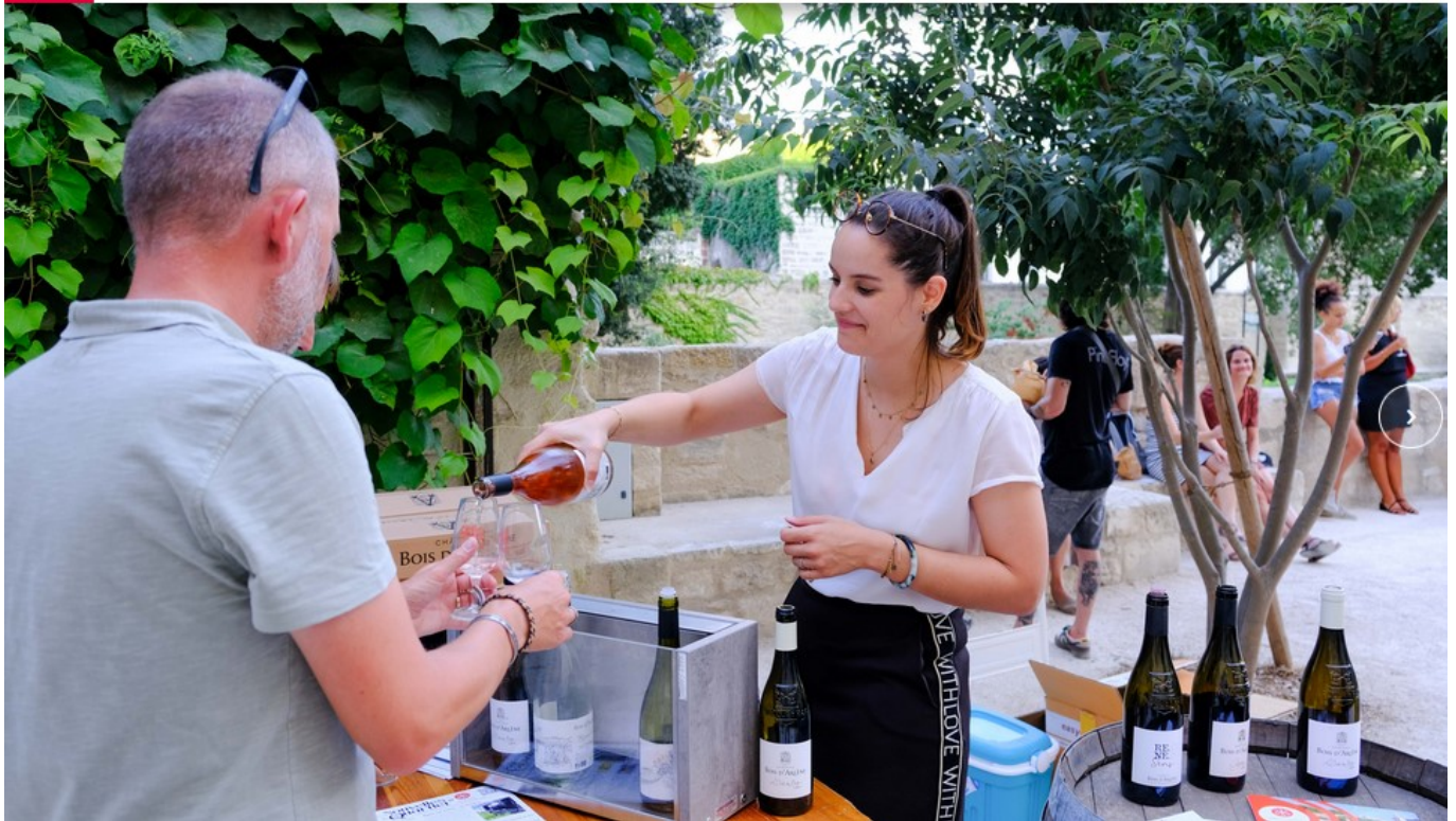
Un verre au jardin