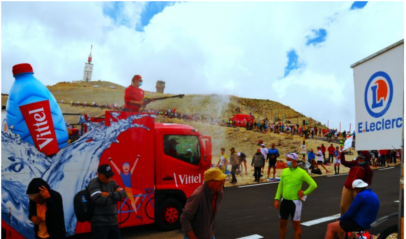
La caravane du Tour de France en 2021.