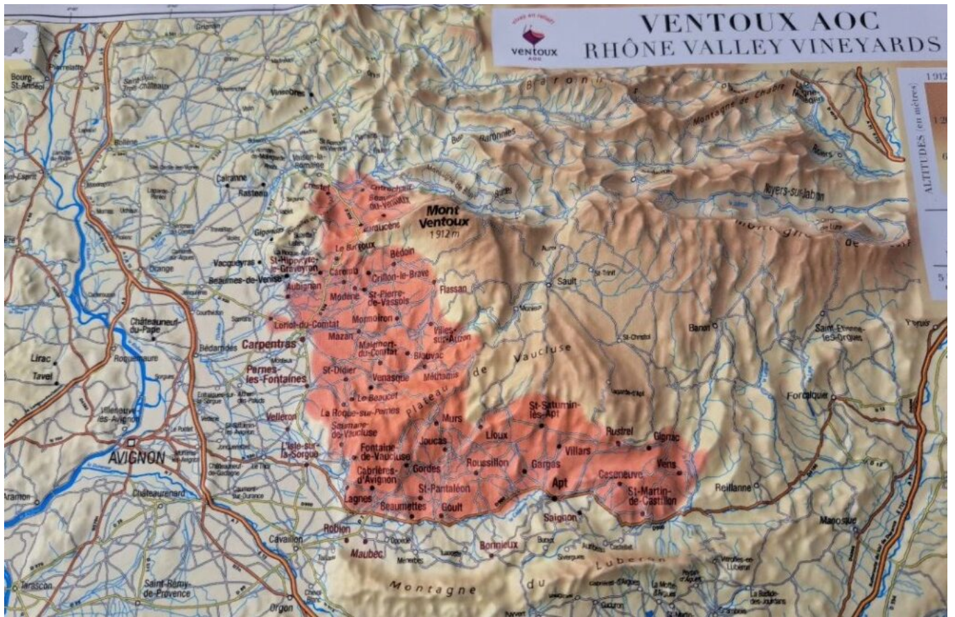
Carte de l'AOC Ventoux.