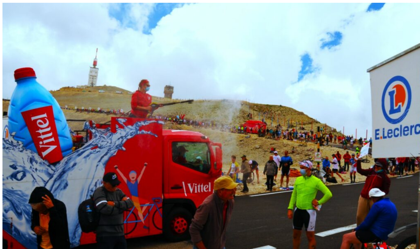
La caravane du Tour de France en 2021.