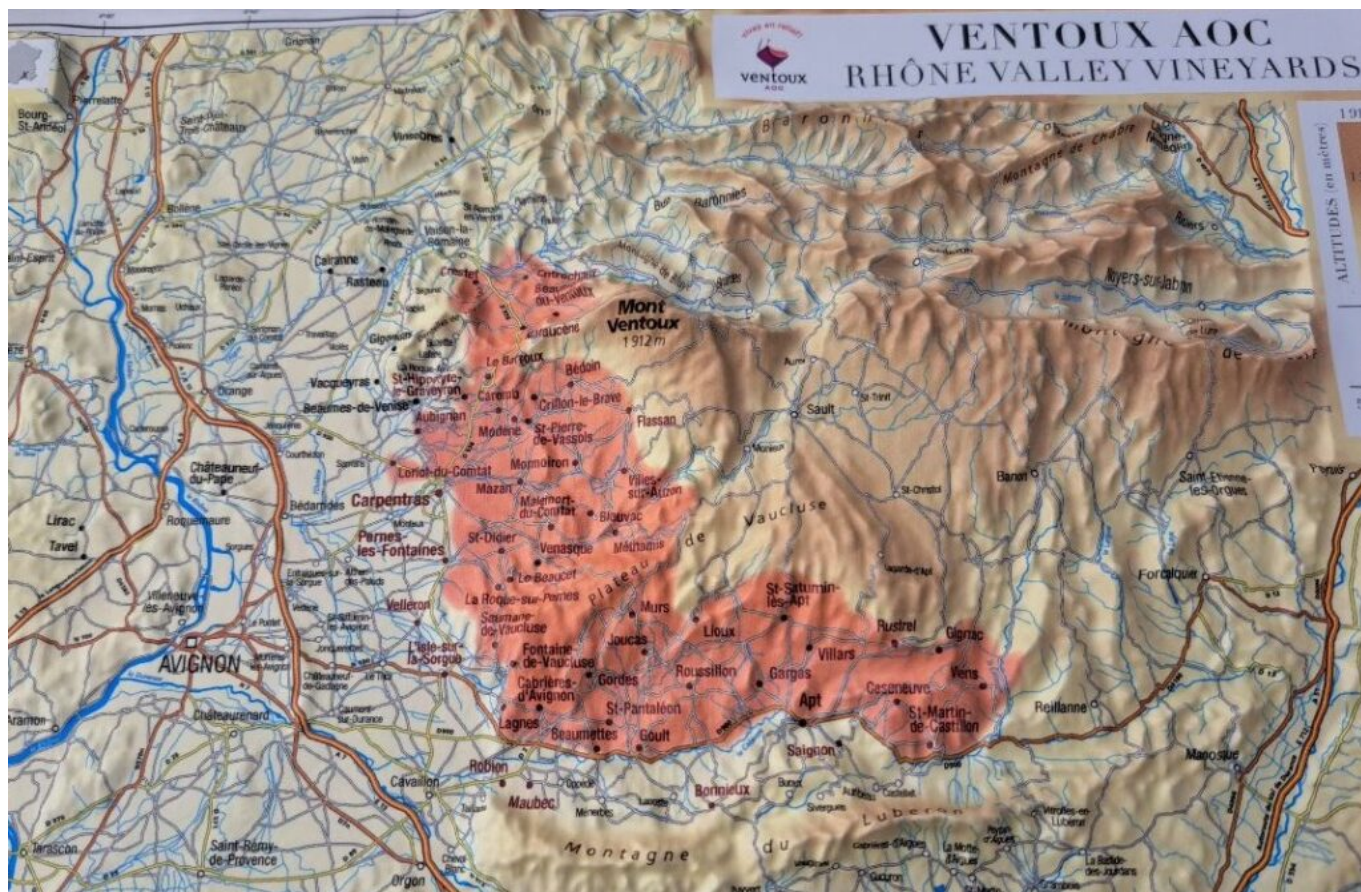
Carte de l'AOC Ventoux.