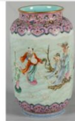
CHINE - XIXe siècle : Vase rouleau en porcelaine à décor émaillé