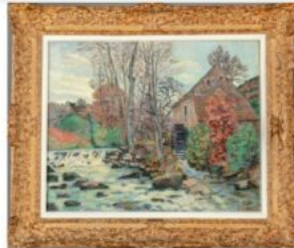
Armand GUILLAUMIN (1841-1927) : Moulin Charraut (dit Bouchardon). Huile sur toile signée en bas à droite, titrée sur le châssis et numérotée 21314. Dim. : 65.5x71 cm...