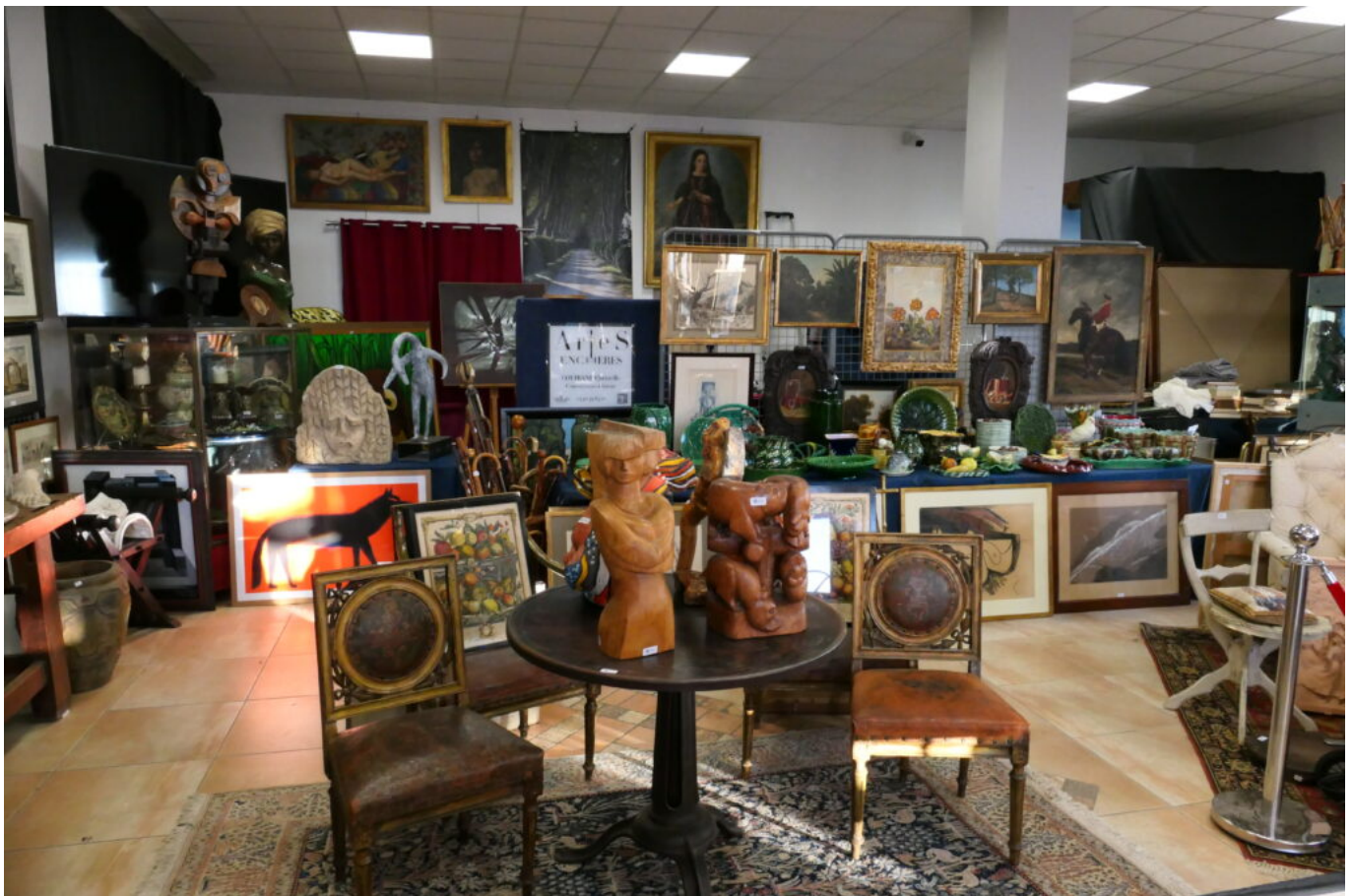
Exposition de la collection Emile Garcin

«Est-ce que je suis stressée avant la vente ? Oui, très, très. Comment je me prépare ? Je m'isole dans un coin, je pense à la vente, je me mets dans ma bulle. Je me prépare mentalement. Le début de la vente ? C'est le plus dur. Il faut mettre l'ambiance, emporter les gens avec soi, créer les conditions de l'envie d'acheter. Est-ce que les gens me contactent à l'avance en me disant qu'ils sont intéressés par certains lots ? Oui, bien sûr, et je garde tout cela secret. On ne peut pas non plus préjuger de ce qui va se passer. C'est la surprise pour tout le monde y compris pour nous. Il y a des lots que l'on met très longtemps à préparer et qui passent en quelques minutes. On n'a pas le temps de penser, de s'attacher au lot qu'il est déjà passé. Une enchère dure très peu de temps. Le maillet a à peine frappé que vous êtes déjà passé au lot suivant. Il faut tenir le rythme.»