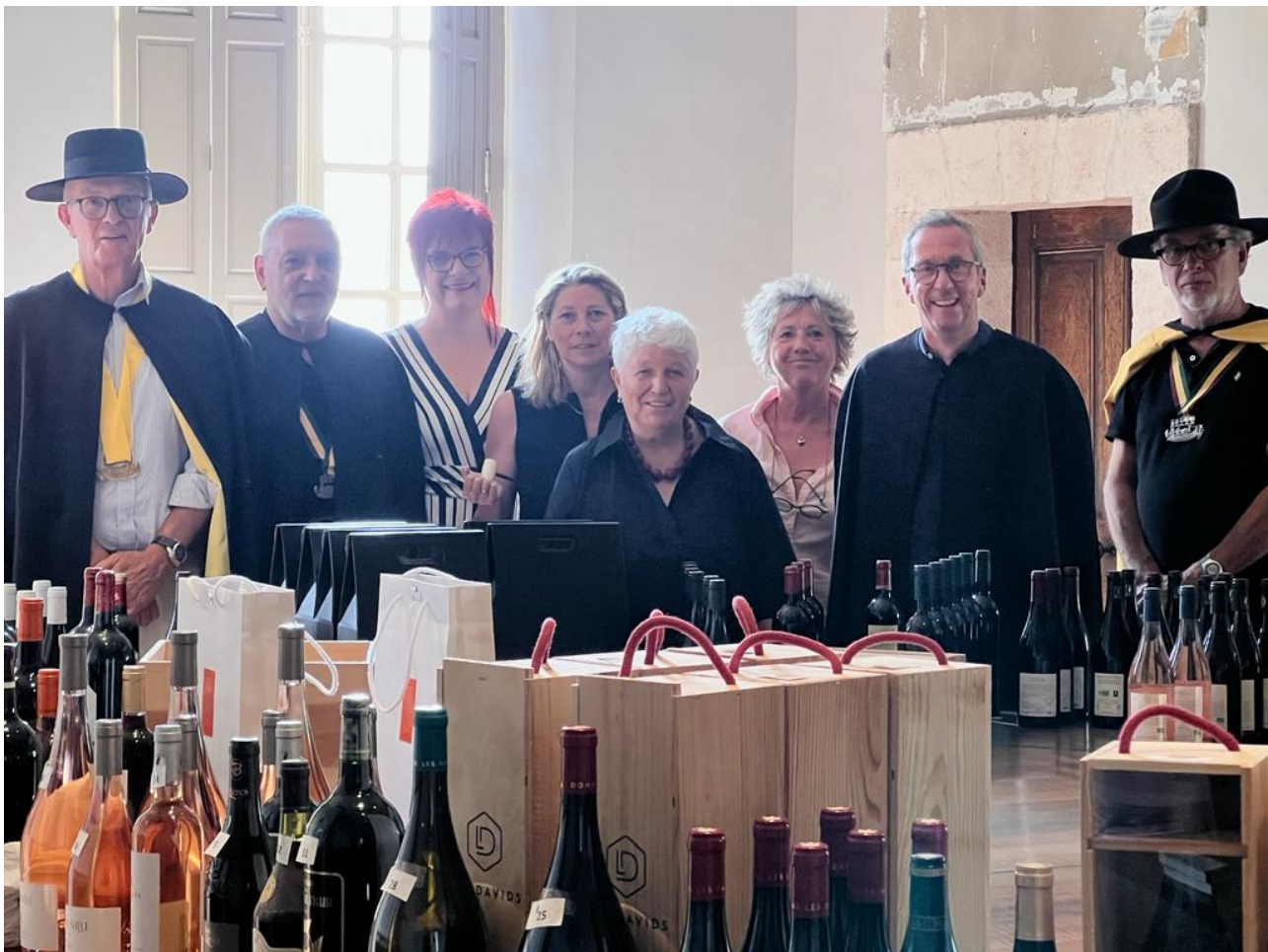
Les organisateurs de la vente aux enchères.