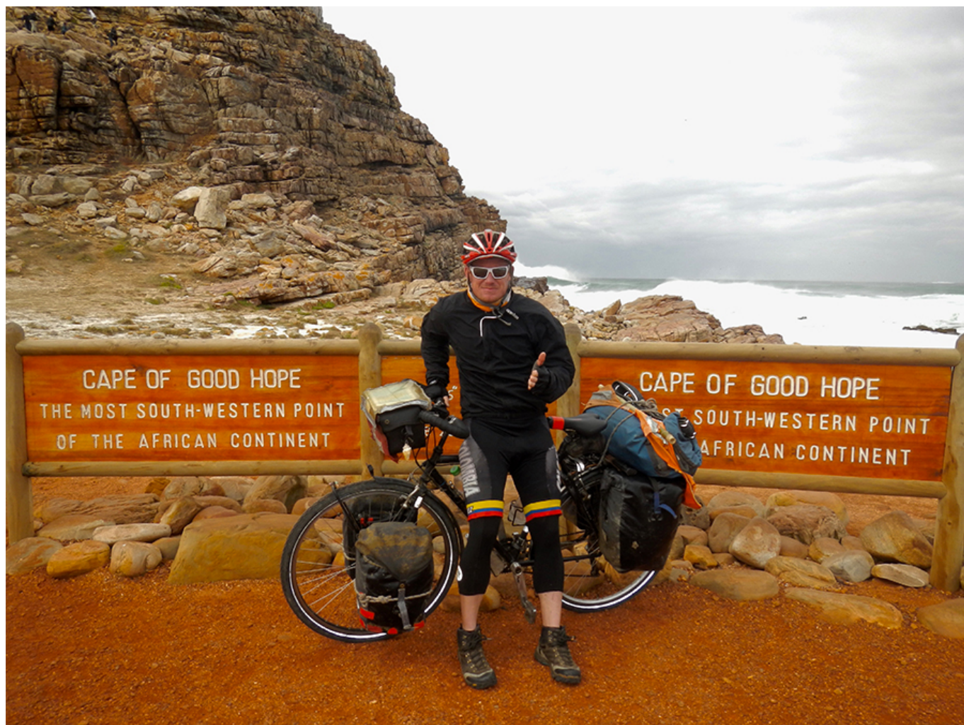
Pascal Bärtschi, l'aventurier à vélo.