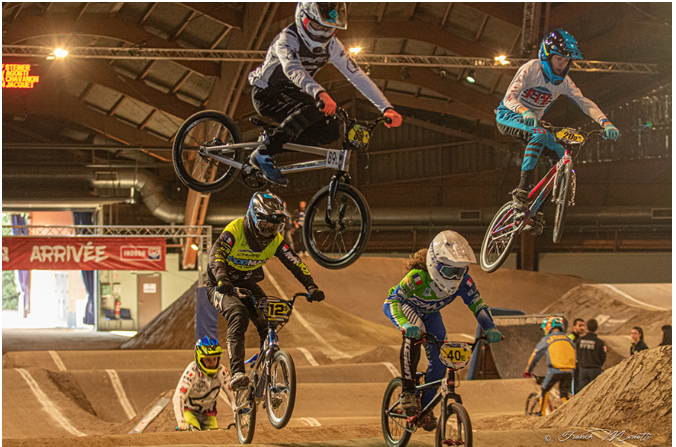
Indoor BMX pour les audacieux.

cargo, BMX, draisienne... Sur près de 35.000 m 2 , un village d'exposants, des animations, des événements sportifs, des rencontres avec les professionnels ainsi que de nombreux temps forts permettront de découvrir le vélo autrement. Trois jours de grand spectacle organisés par la ville d'Avignon et Avignon Tourisme, avec le soutien de la Région sud, du Département de Vaucluse, du Grand Avignon et de la Fédération française de cyclisme de Vaucluse.