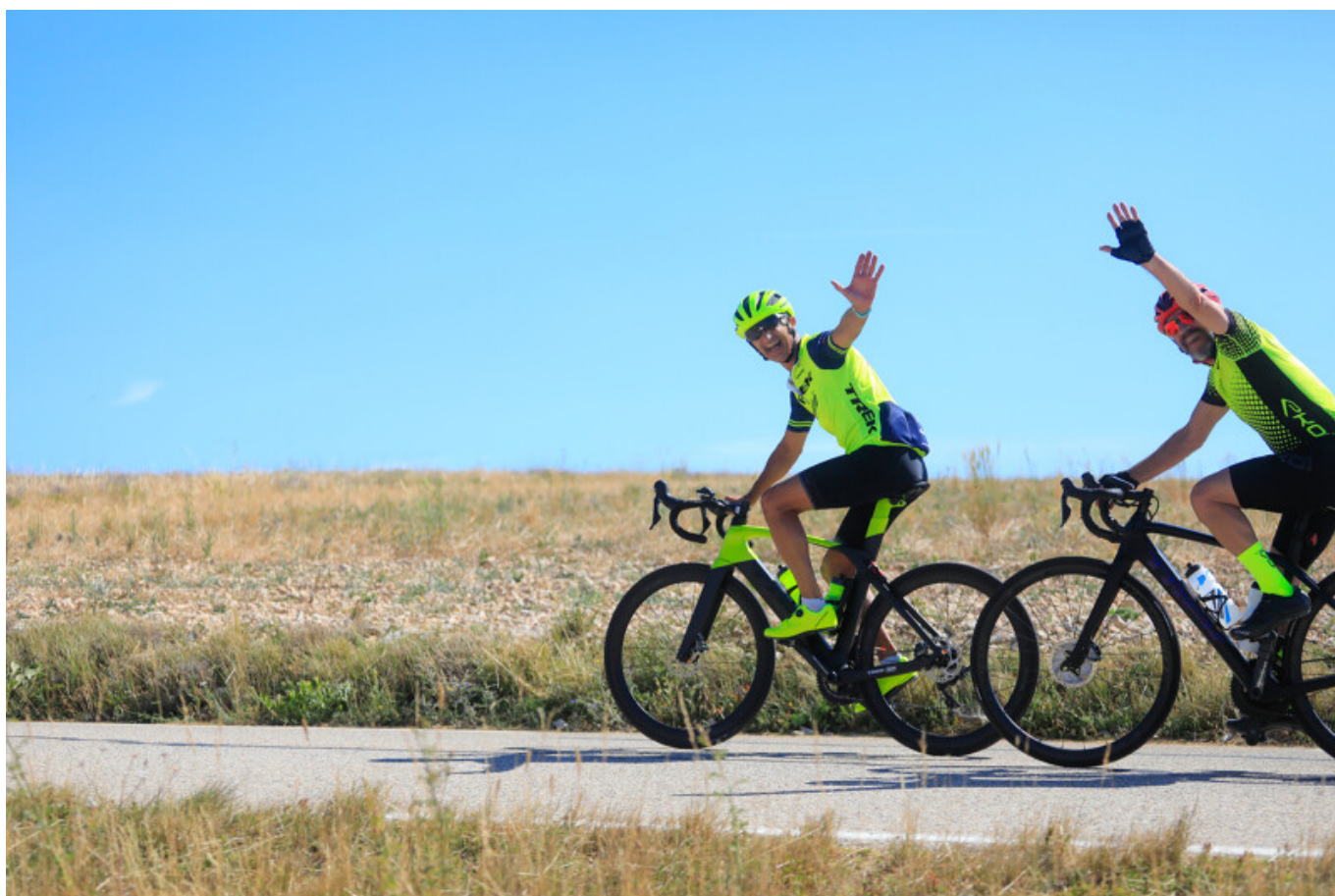
HOCQUEL A - VPA

Vélo Loisir Provence lance la réalisation d'une enquête vélo dans le Luberon et le Verdon. L'objectif de cette enquête grand public est de recueillir l'avis des pratiquants vélo sur ces destinations, afin de définir au mieux les usages et évaluer les besoins et attentes quant aux différents services et aménagements vélos.