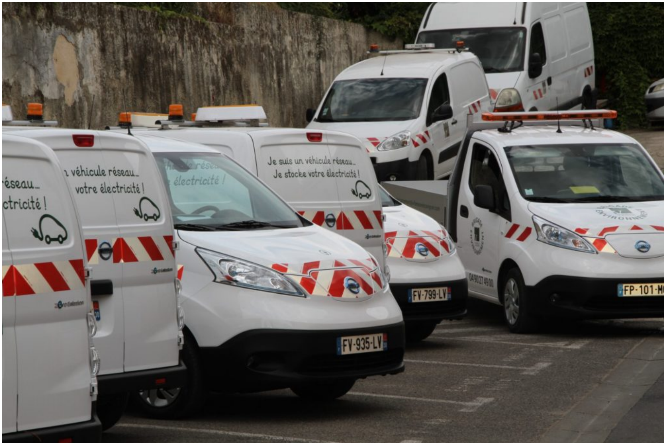
Villeneuve-lez-Avignon vient d'acquérir 7 véhicules utilitaires Nissan 100% électriques