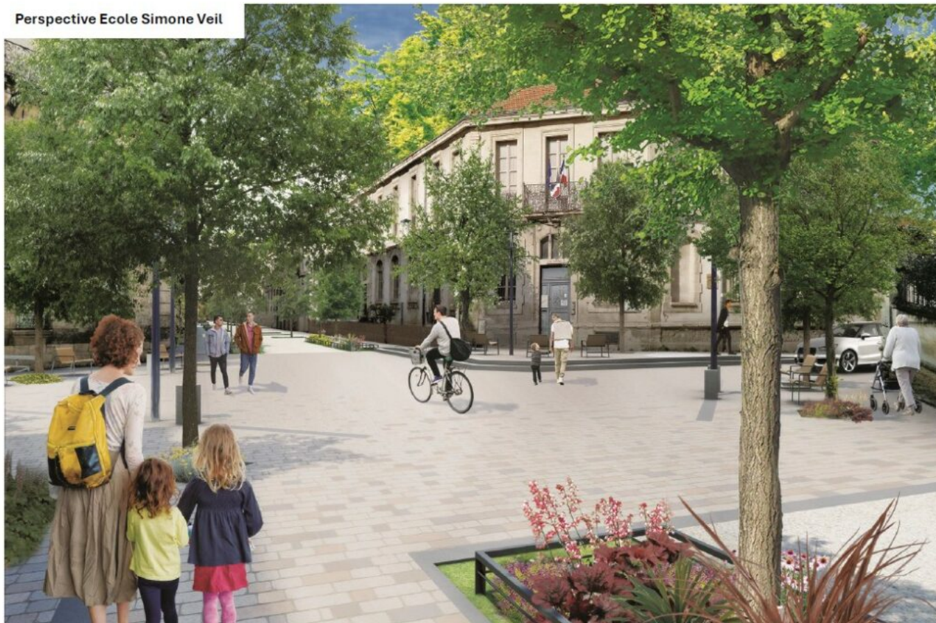
Perspective Ecole Simone Veil