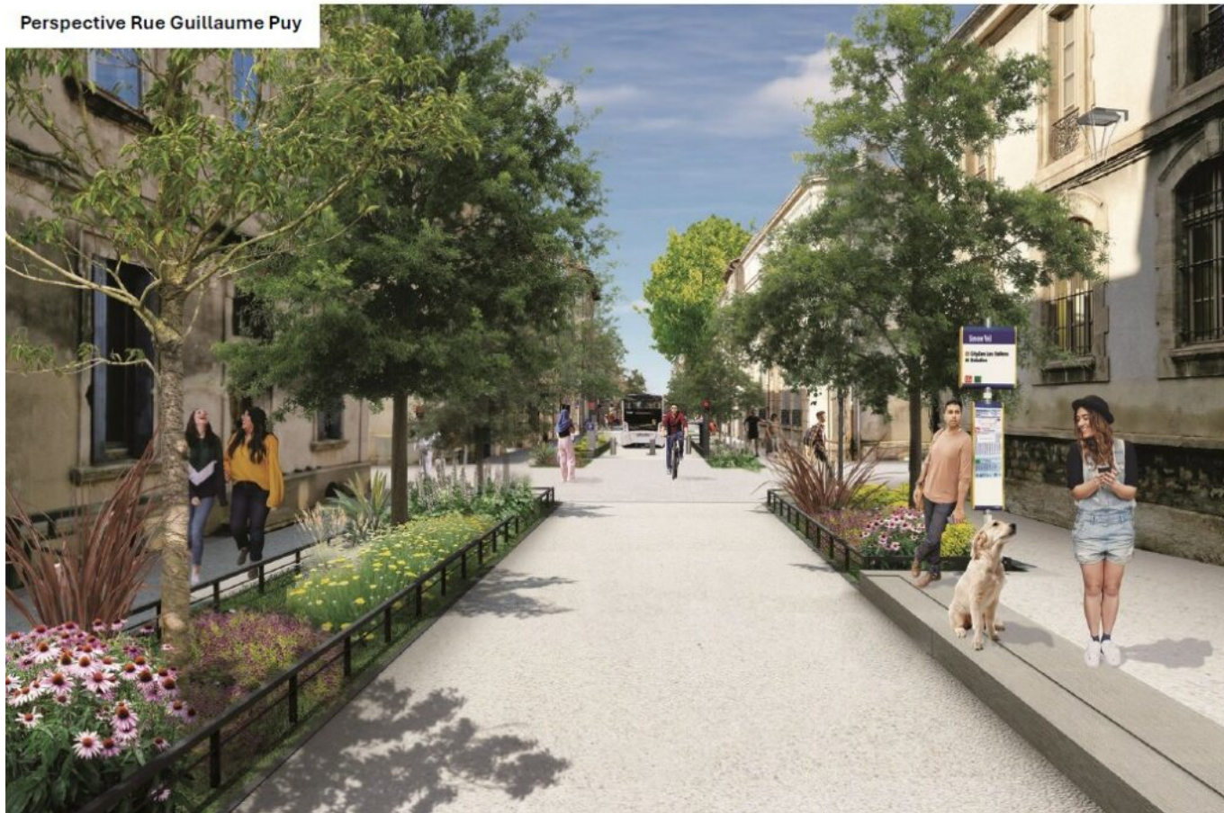
Perspective Rue Guillaume Puy

Les travaux de réhabilitation de la rue Thiers vont reprendre maintenant, s'étendre jusqu'en décembre et devraient avoisiner les 3,7M€. Objectif : arborer et végétaliser la ville pour en 'upgrader' le cadre de vie. Mission ? Redonner leur place aux habitants, familles, écoles et commerces de l'intramuros où le tout voiture avait jusqu'alors, préempté la vie sociale.