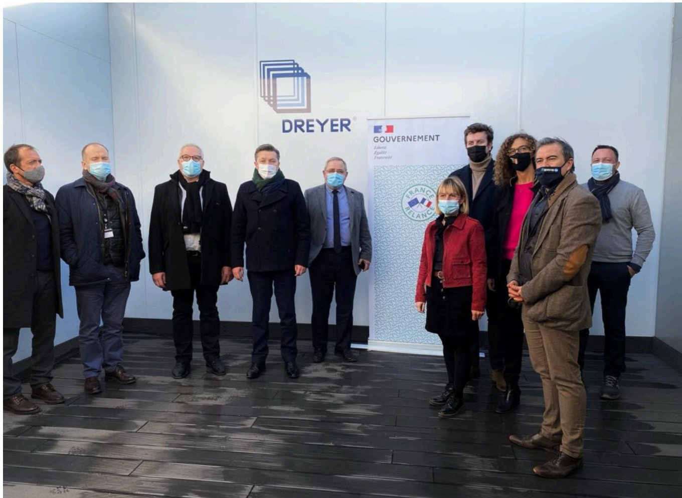
Visite de la préfecture à Dreyer. Dreyer en quelques minutes en vidéo

Intermarché, Auchan, Leclerc, Métro, Cora, Carrefour, Casino et bien d'autres . Cette année, l'entreprise a été bénéficiaire du plan France relance à hauteur de 400.000€ pour l'extension de sa surface d'exploitation et la modernisation de son outil de production.