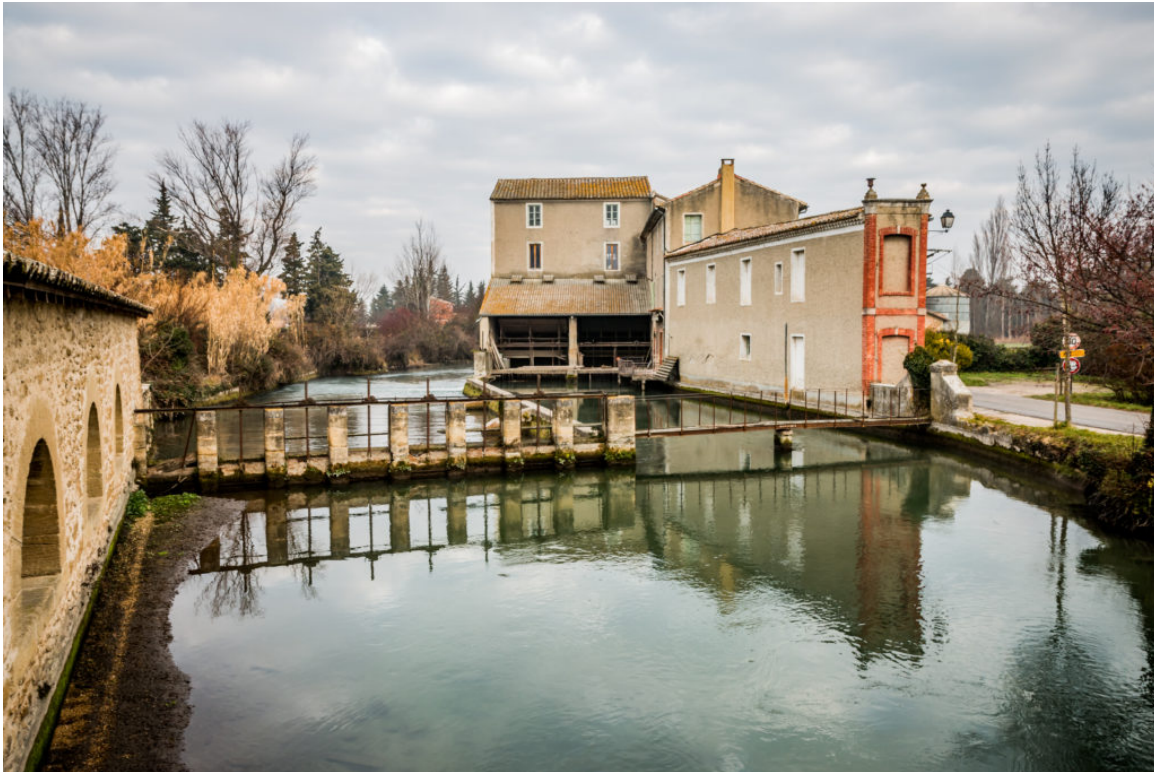
Dans la strate des villes vaclusiennes de 3 500 à 5 000 habitants, c'est Saint-Saturnin-lès-Avignon qui arrive encore en tête cette année.