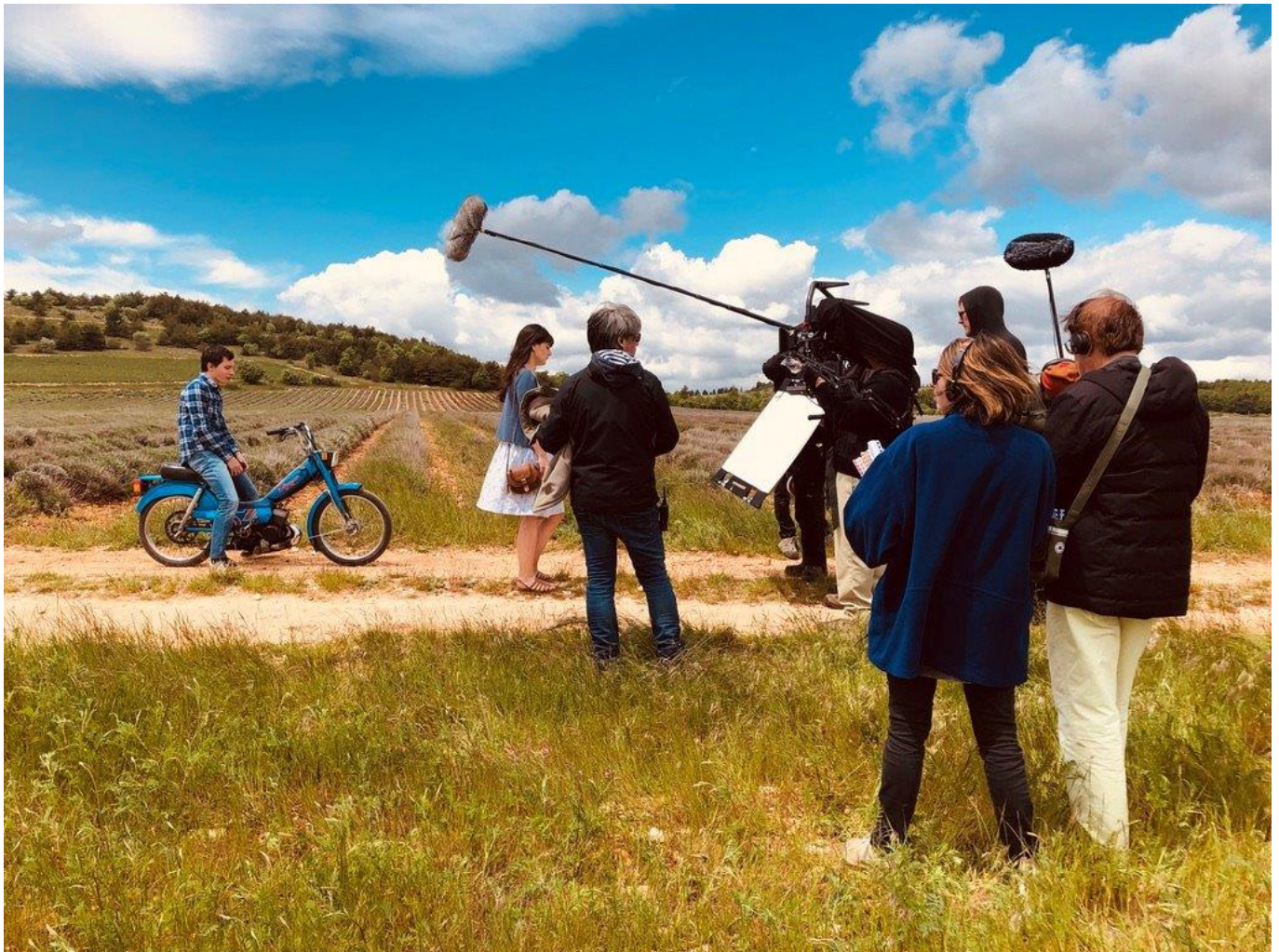
Tournage de 'Grand Ciel', filmé à Valréas et à Sault.