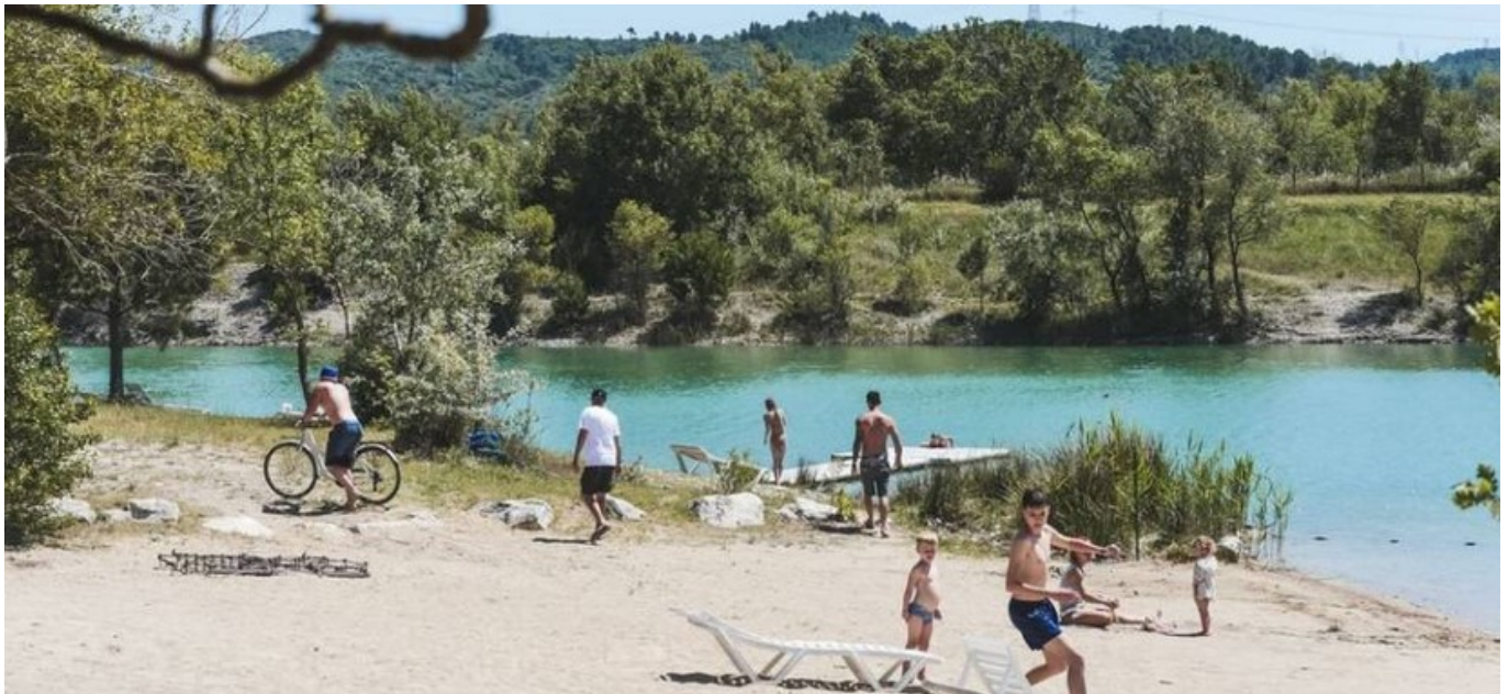
DR Plan d'eau de Cadenet du camping de Val de Durance