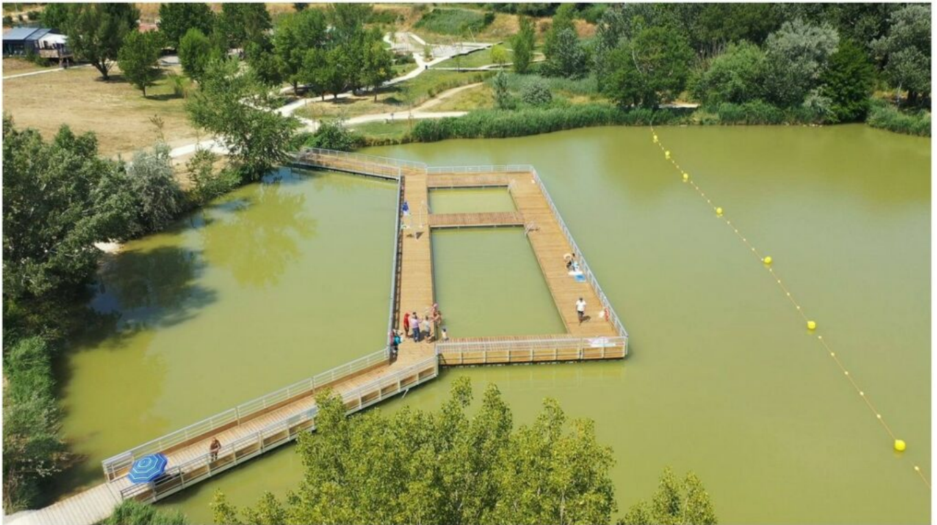
La Riaille à Apt