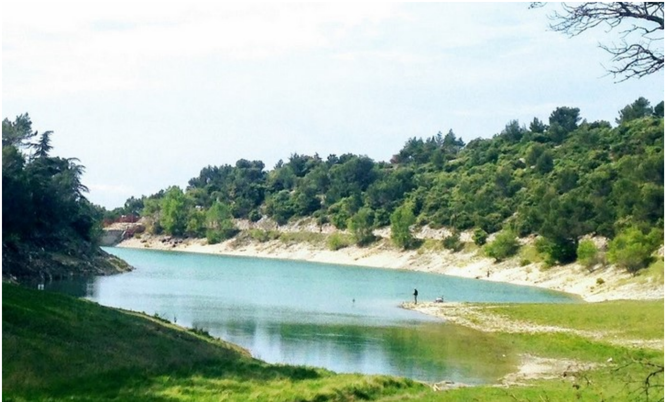
Le Lac du Paty à Caromb