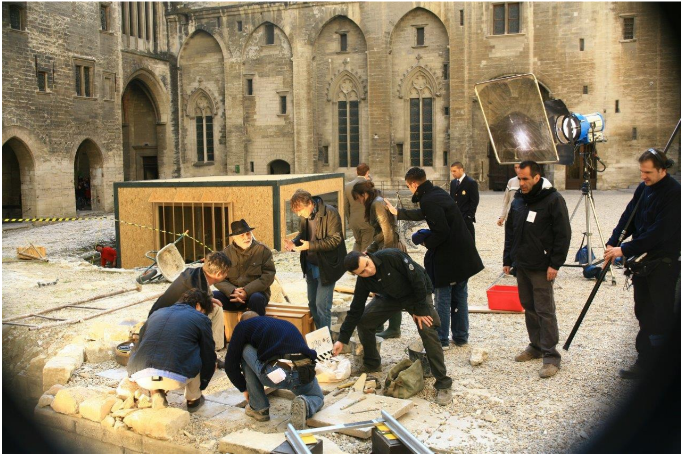
Tournage de la mini-série 'La prophétie d'Avignon'.