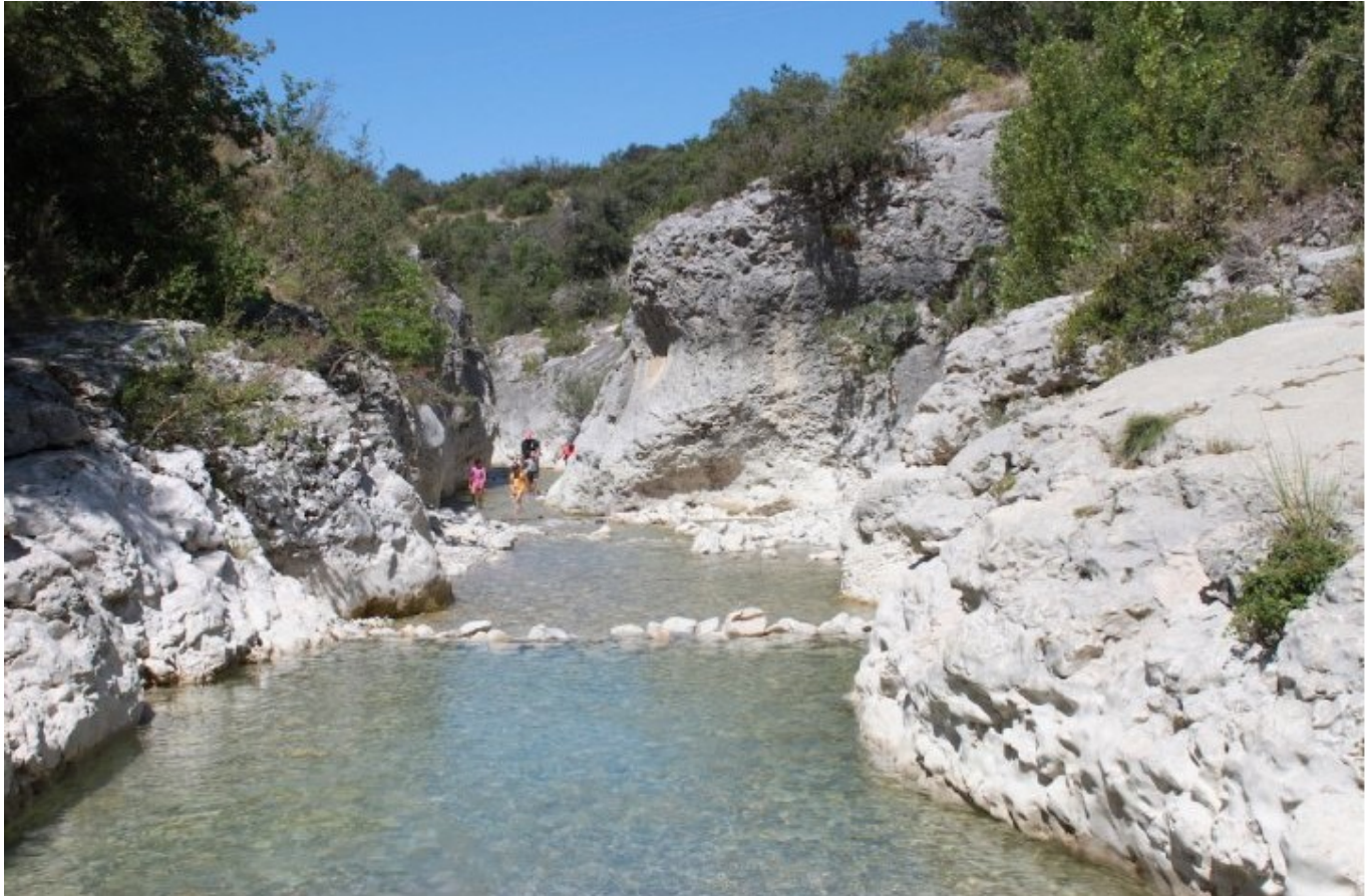
Les gorges du Toulourenc

Gorges du Toulourenc à Malaucène, Entrechaux et Saint-Léger du Ventoux.