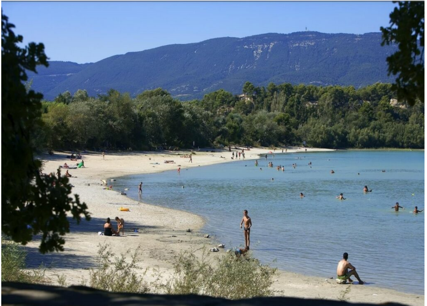
DR Etang de la Bonde à Cabrières d'Aigues