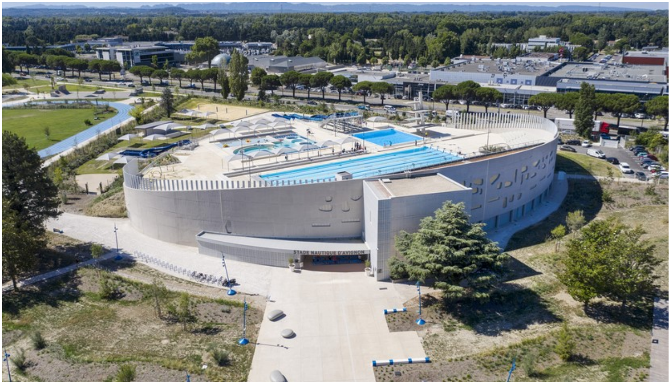
Le stade nautique à Avignon

Avenue Pierre de Coubertin à Avignon 04 13 60 54 50 http://www.avignon.fr/espaces-culturels-et-sportifs/les-piscines-municipales/