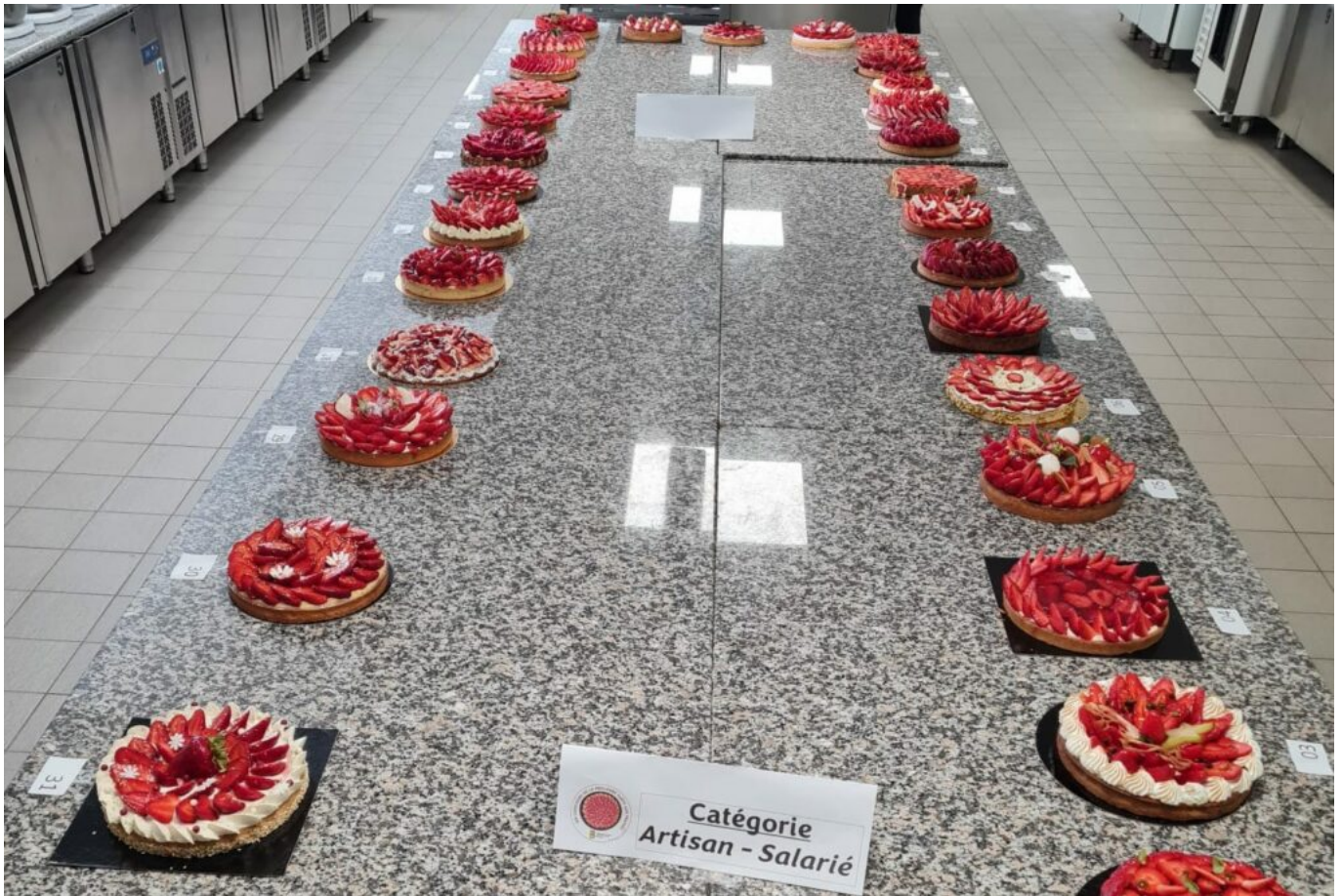
© Groupement des artisans Boulangers Pâtisiers du Vaucluse