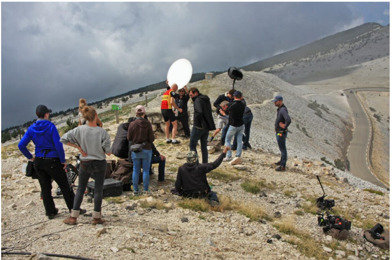
VMA CFLV-LMVentoux 2016