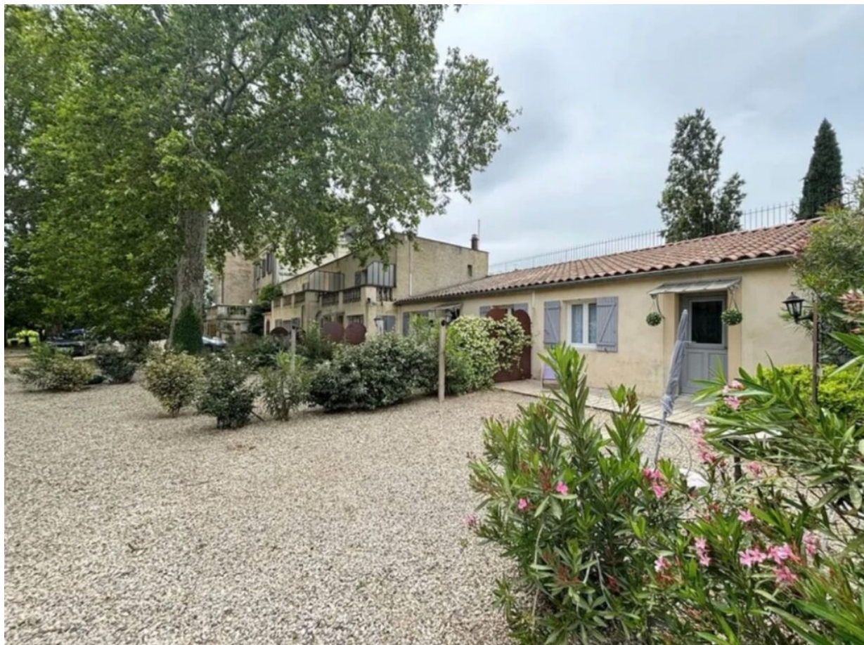
Les logements pour les seniors.