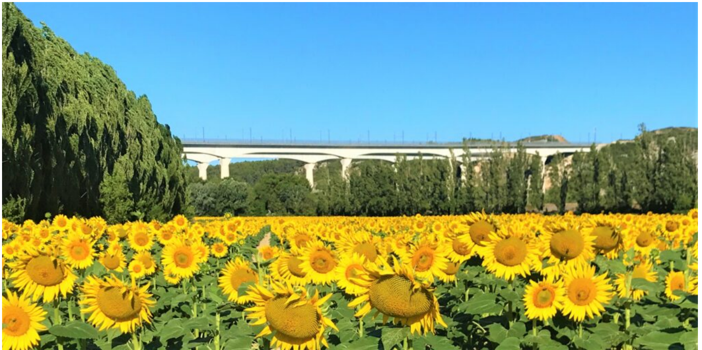
La photo d'origine.