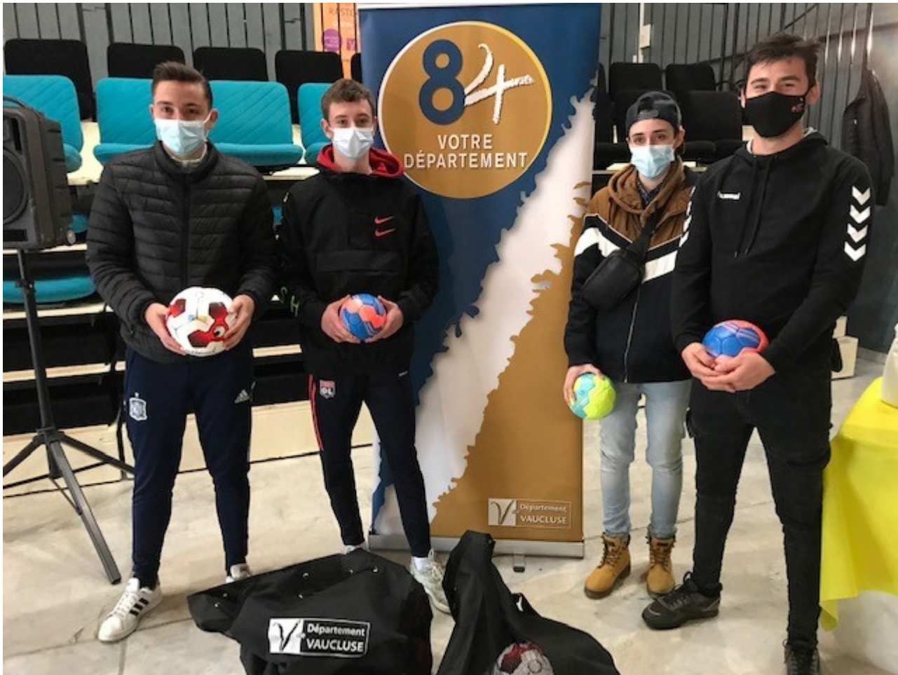
Remise de 418 ballons au Centre départemental de plein air et de loisirs à Rasteau.