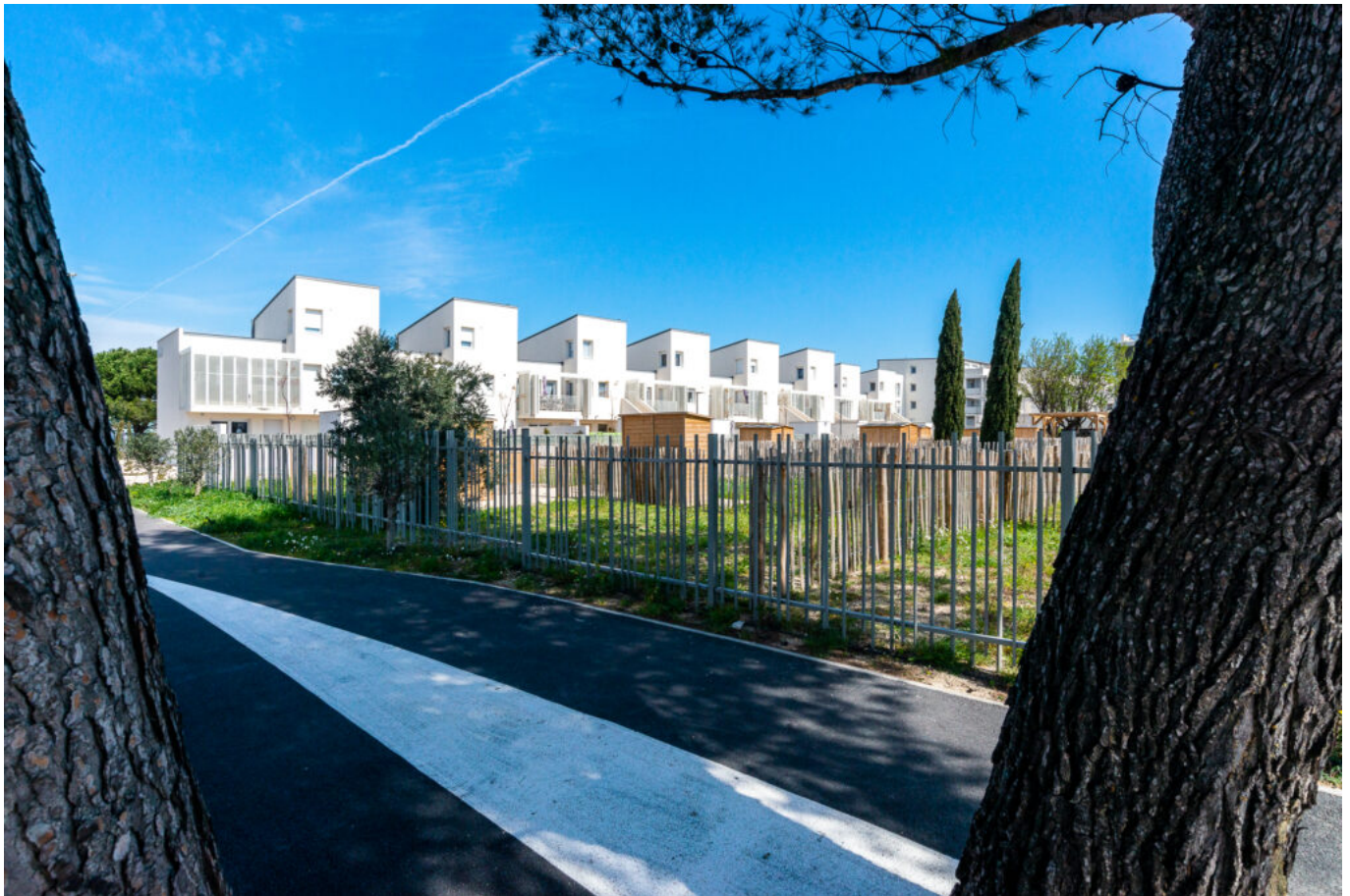
Ecoquartier les Oliviers