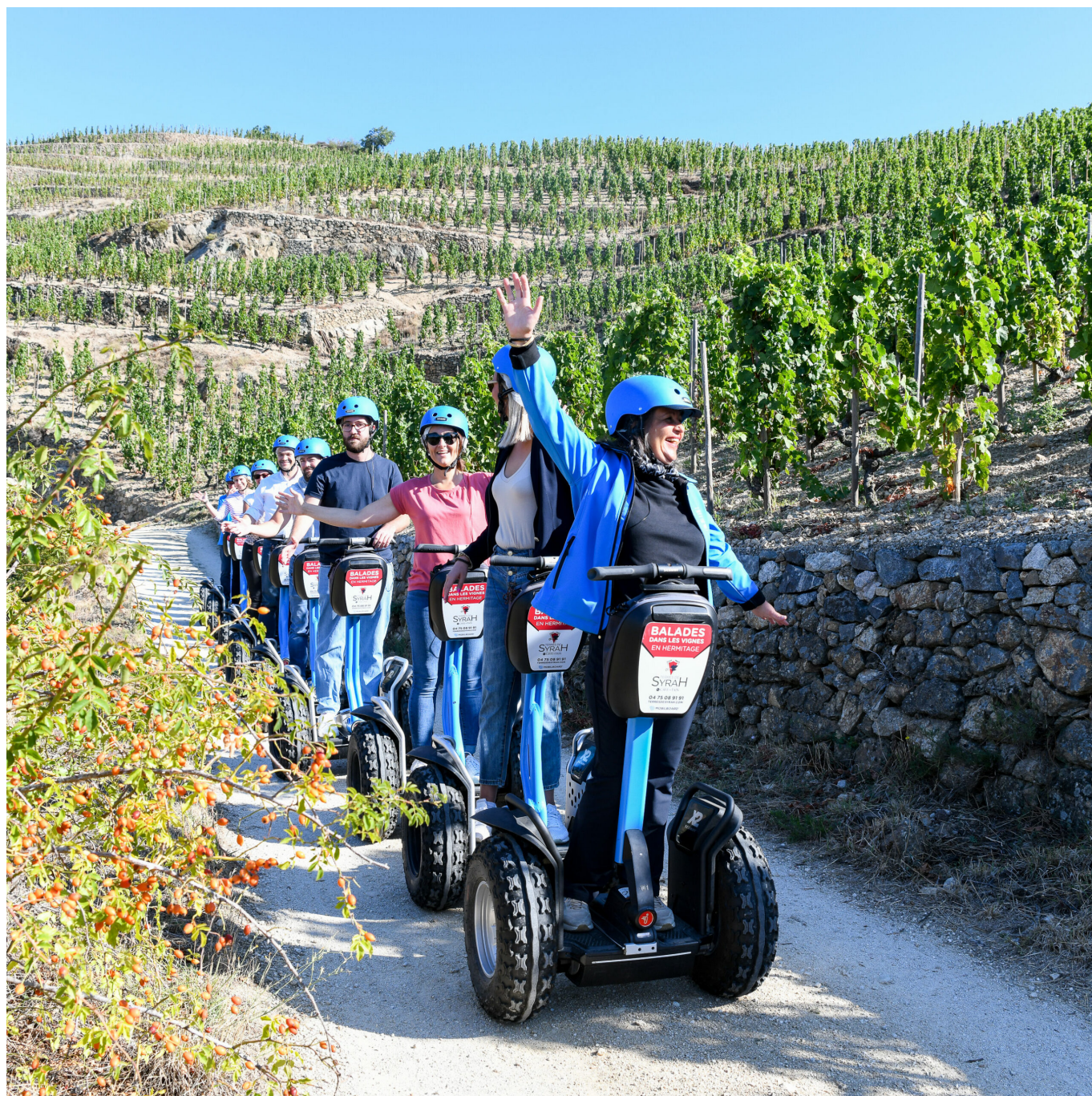
CAVE DE TAIN