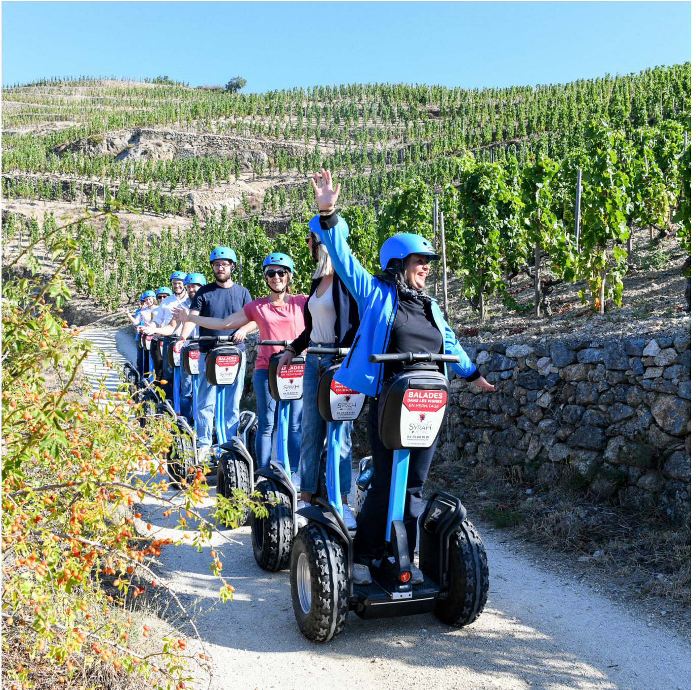
CAVE DE TAIN