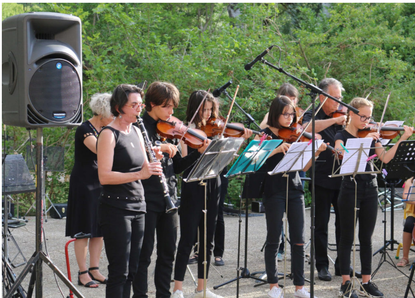
© Ecole de musique et danse Vaison Ventoux