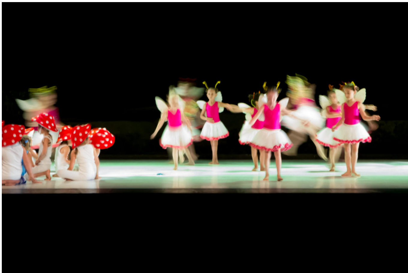
© Ecole de musique et danse Vaison Ventoux

Avec l'école de musique et de danse Vaison Ventoux, les plus jeunes ont la possibilité de s'initier dès 4 ans à la découverte des appuis, de l'espace, du rythme et des sensations liées au mouvement à travers les cours de sensibilisation, puis d'initiation à la danse. Un peu plus grands, les enfants et adolescents débutent l'apprentissage technique de la danse contemporaine ou classique. L'école propose également un atelier de création chorégraphique le samedi, accessible aux élèves qui suivent au moins un cours hebdomadaire en classique ou contemporain.