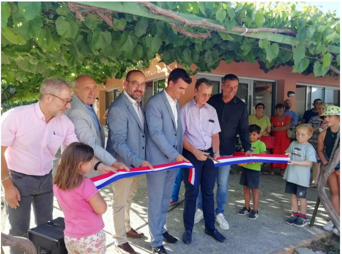
Inauguration des travaux de réhabilitation de l'accueil de loisirs intercommunal la courte échelle à Vaison-la-Romaine

Le chantier de réhabilitation s'est étendu du novembre 2020 au printemps 2021 -6 mois- pour un montant de 566 000€. Il a été soutenu par l'Etat -140 270€-, le Département -154 983€- et la Caisse d'allocation du Vaucluse -50 000€-. C'est Opus architecture de Vaison-la-Romaine, qui a eu en charge la conception de la réhabilitation. L'actuelle capacité d'accueil du bâtiment est de 230 enfants l'été. Il en recevait 150 en 1999.