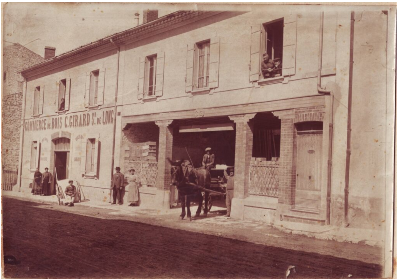
Image d'archives des établissements Benjamin Long.

Cette année, Augier célèbre donc ses 125 ans. Ce sont cinq générations qui se sont succédé et qui ont fait de l'entreprise ce qu'on connaît d'elle aujourd'hui, à savoir une société pluridisciplinaire, qui maîtrise plusieurs métiers : les matériaux, la menuiserie, le carrelage, le sanitaire, la cuisine et le bricolage.