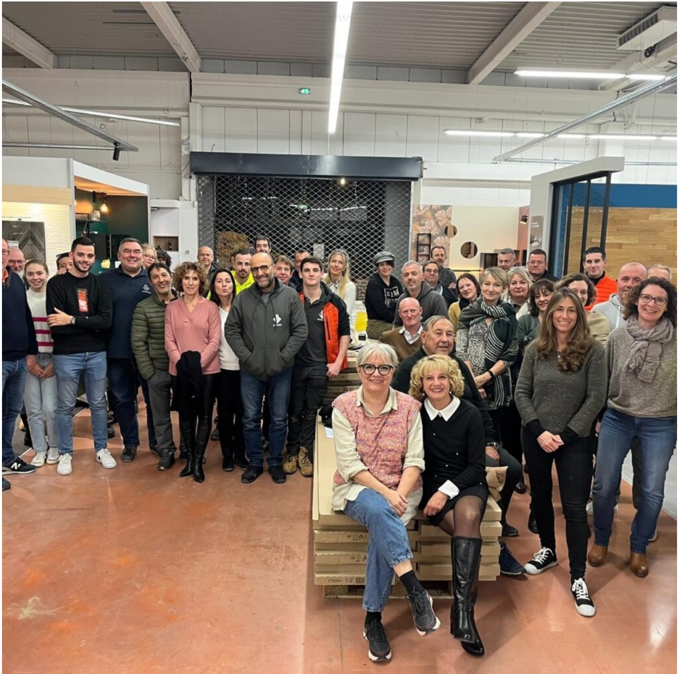
L'équipe Augier.