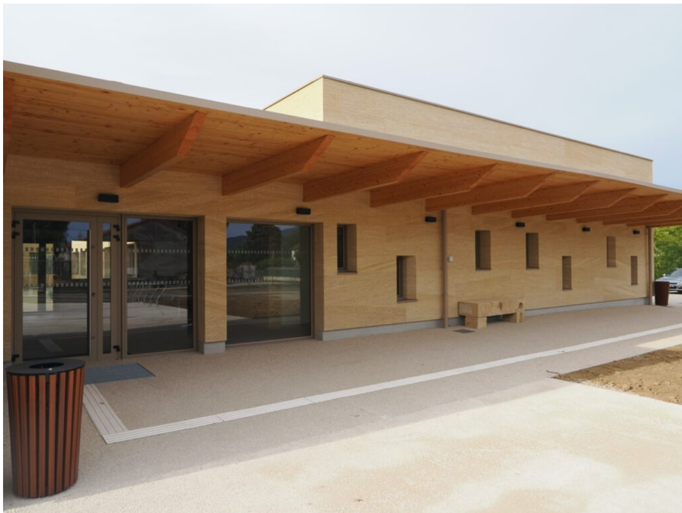
La salle Sandrine Martinet

La salle Sandrine Martinet sera inaugurée le samedi 12 octobre à 18h en présence de la championne paralympique.