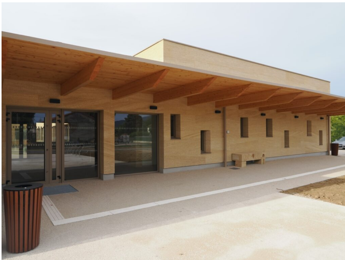
La salle Sandrine Martinet

La salle Sandrine Martinet sera inaugurée le samedi 12 octobre à 18h en présence de la championne paralympique.