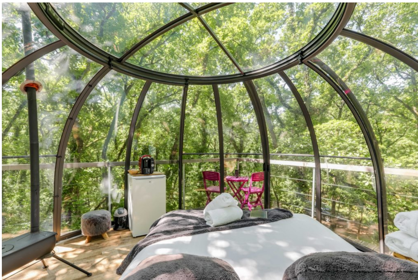
Lit bulle perchée

« De manière générale, il y a un énorme potentiel de développements insolites, qui se heurte quelques fois aux contraintes. Je pense à la réglementation relative à la protection des parcs naturels régionaux, qui rend les démarches plus compliquées », souligne-t-il. Les villes plébiscitées ? « Les milieux ruraux, tout ce qui se situe à 3h des grandes villes fonctionne très bien. Si vous tenez à avoir quelques exemples, la Bretagne et l'Aquitaine recensent beaucoup d'hébergements. Mais il en existe absolument partout en France, même si dans le Vaucluse, on n'en compte un peu moins. Il y en a dans la Drôme également. »