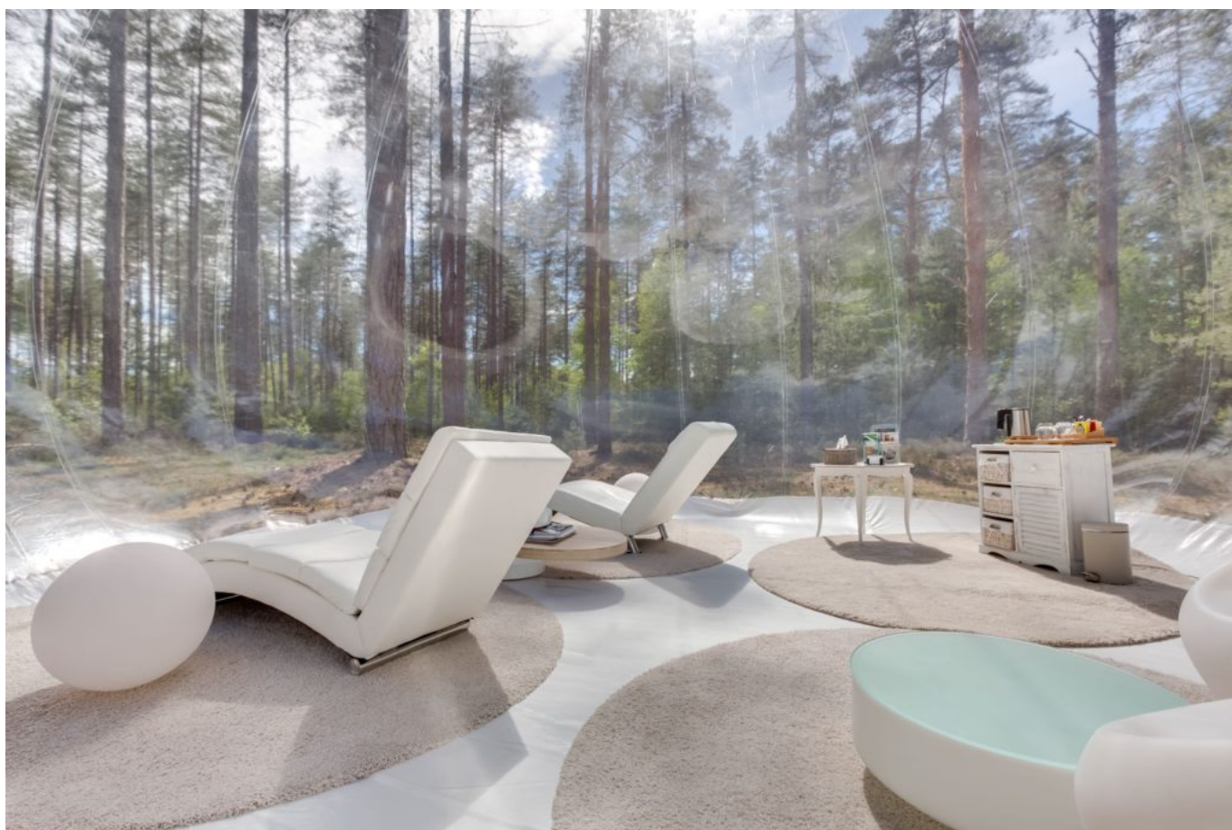
Bulle de cristal