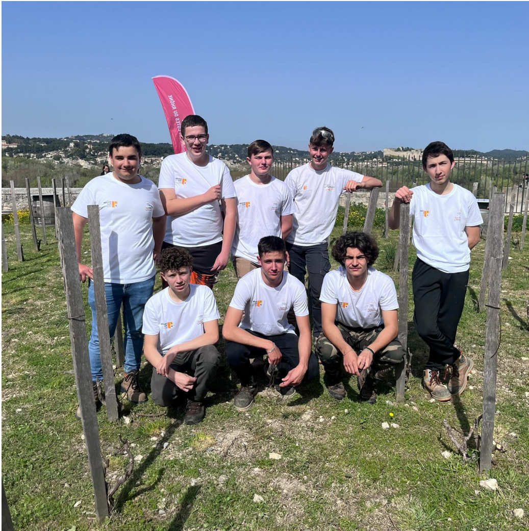
Les élèves du lycée viticole d'Orange