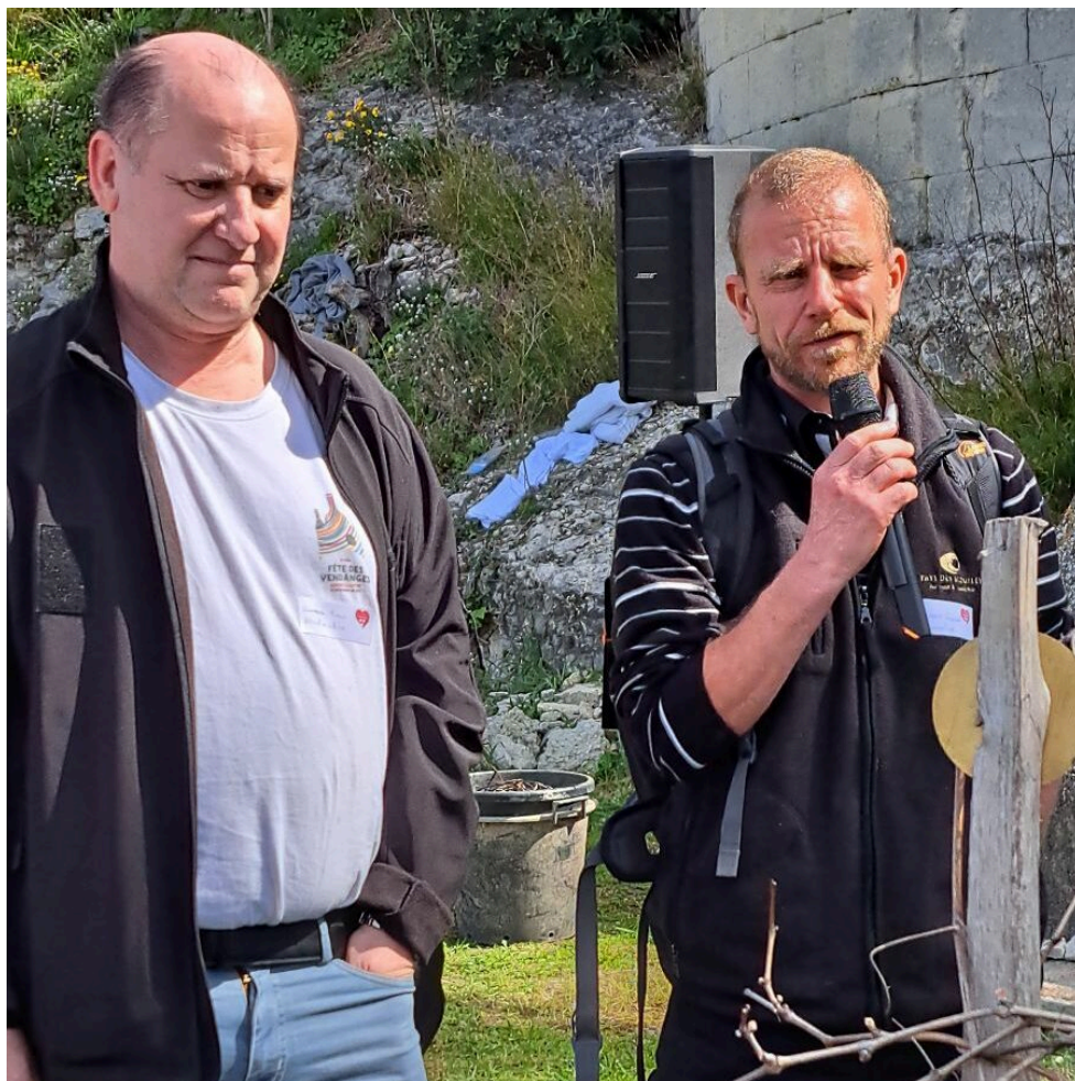
Les représentants de la Vigne de Montmartre invités par les Compagnons des Côtes du Rhône

Contact : www.compagnonscotesdurhone.com