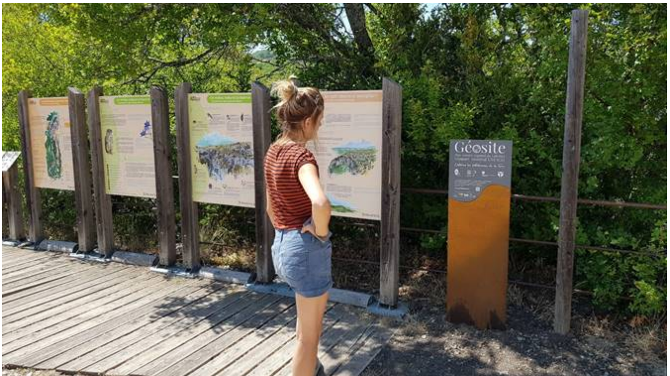
Les gorges d'Oppedette, géosite du Luberon

Cette carte met en lumière : 51 géosites ; un réseau de géopartenaires ; des bons plans pour accompagner la découverte du territoire. Gratuite, la carte « Géotourisme en Luberon » est disponible : à la Maison du Parc (04 90 04 42 00) ; dans les offices de tourisme du Luberon ; en téléchargement sur www.parcduluberon.fr/geotourisme .