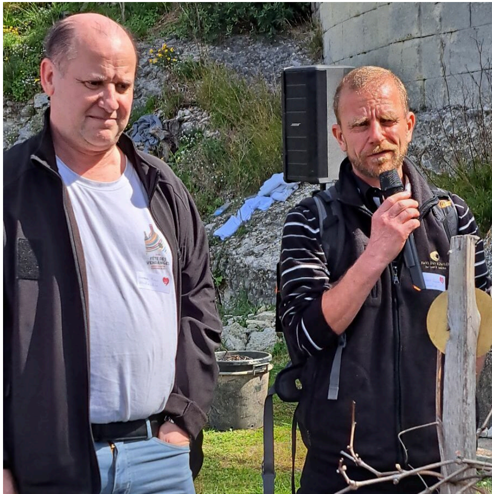
Les représentants de la Vigne de Montmartre invités par les Compagnons des Côtes du Rhône

Contact : www.compagnonscotesdurhone.com