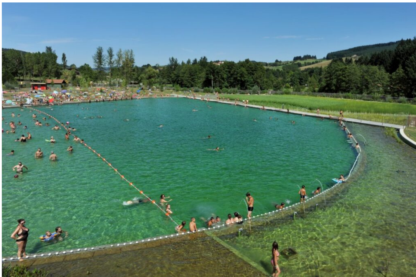
Piscine naturelle au lac des Sapins

aquatiques. La température de l'eau ne dépassera guère 25°C, mais répond pleinement à l'ambition de départ : la recherche de fraîcheur. Un espace privilégié, surtout quand la baignade est limitée à cause des fortes chaleurs sur le reste du site. Néanmoins, le tour du lac se fait facilement à pied. Pour les plus sportifs, coureurs comme cyclistes (faire le tour du site en VTT électrique est une belle option à la portée de tous) pourront suivre les tracés dédiés.