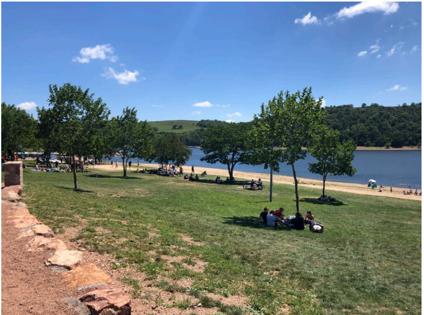
Le lac de Villerest