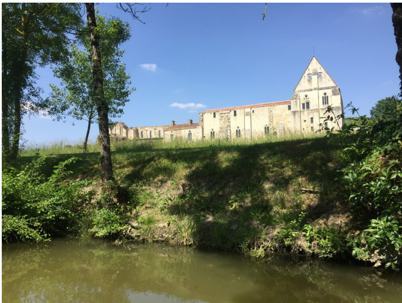
L'abbaye de Maillezais depuis les canaux du Marais poitevin.