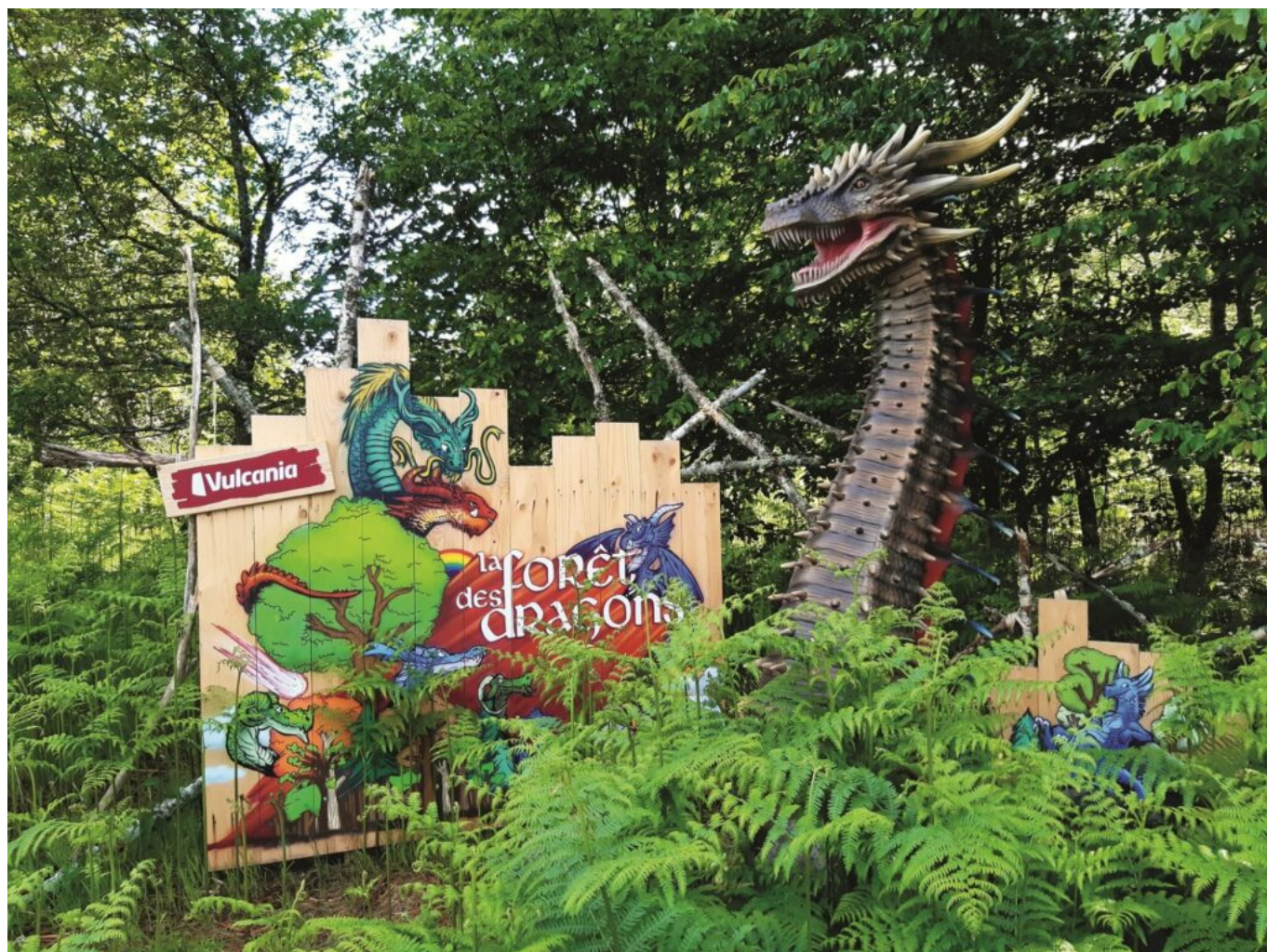
Vulcania, la forêt des dragons