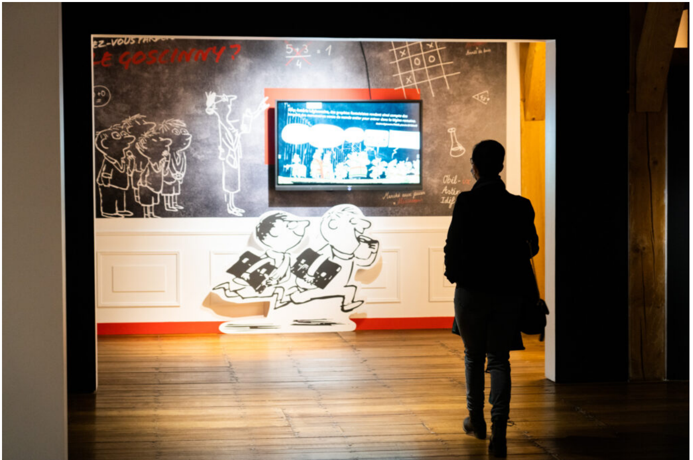
L'Exposition Goscinny au Château de Malbrouck.