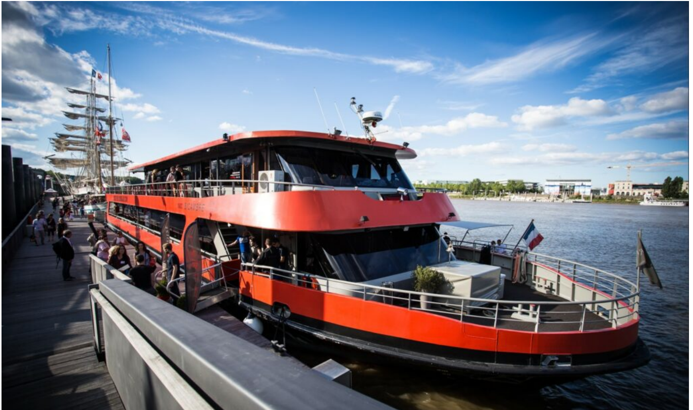
Le Sicambre à Bordeaux