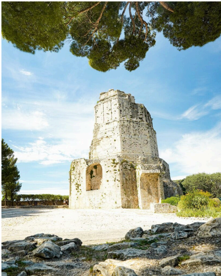
La Tour Magne sur les hauteurs de la ville.