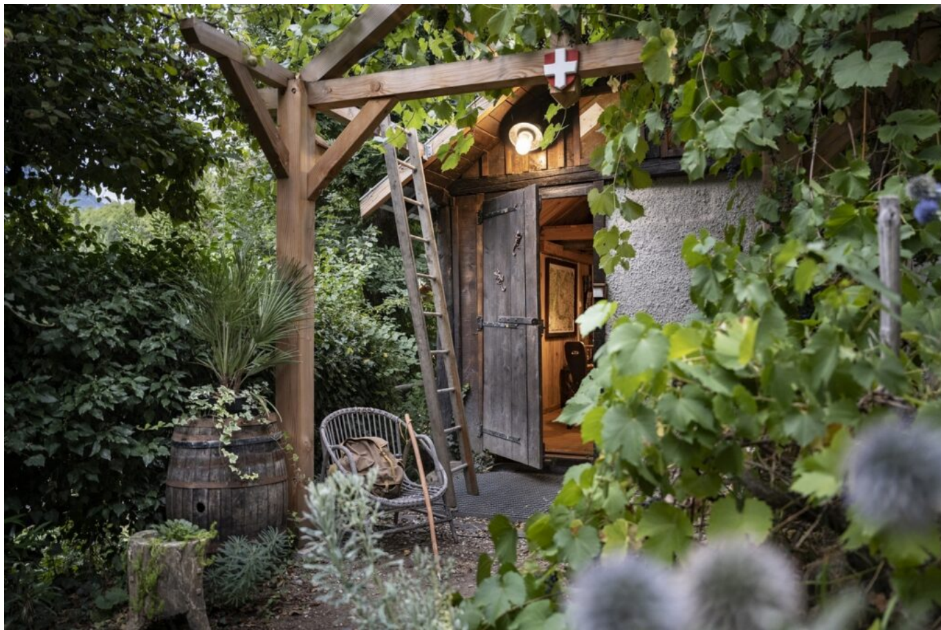
Le Refuge Princens à Saint-Jean-de-Maurienne.