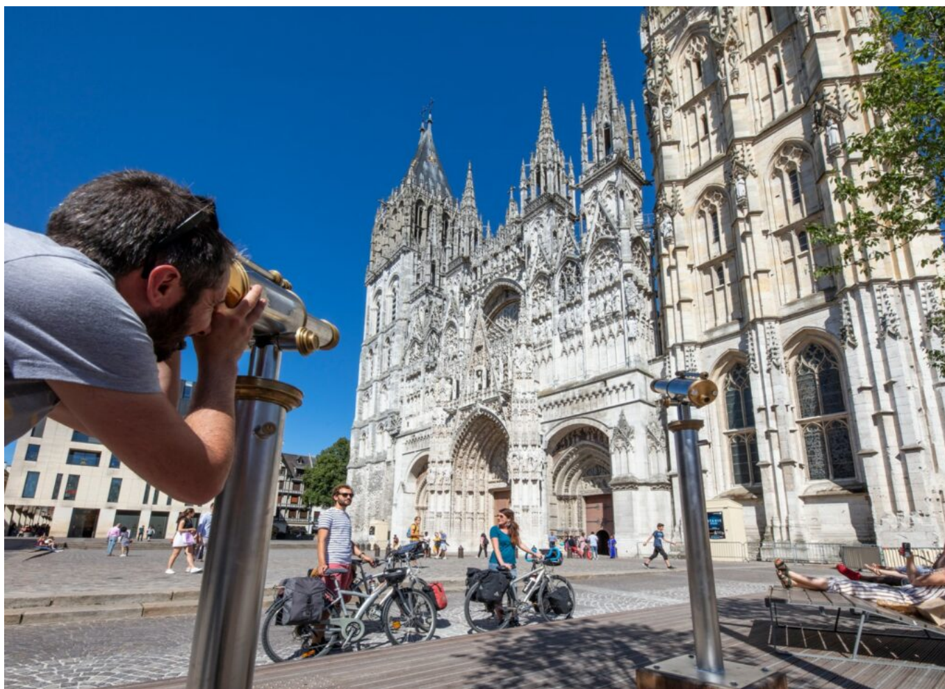
La cathédrale Notre-Dame-de-Rouen se situe en plein cœur de la capitale normande.

Depuis Rouen, direction La Bouille ! Les clochers de la capitale normande laissent place aux grues du premier port exportateur de céréales d'Europe, avant de s'effacer pour dévoiler les villages de grès et colombages typiques de Normandie. Les cyclistes pédalent au cœur du Parc naturel régional des boucles de la Seine. Pour rejoindre La Bouille, sur l'autre rive de la Seine, pas de pont mais un bac, une tradition fluviale qui perdure en Seine-Maritime. Classé sixième lors de la dernière édition du Village préféré des Français, La Bouille est un charmant village qui a su séduire Turner, Sisley ou encore Gauguin.