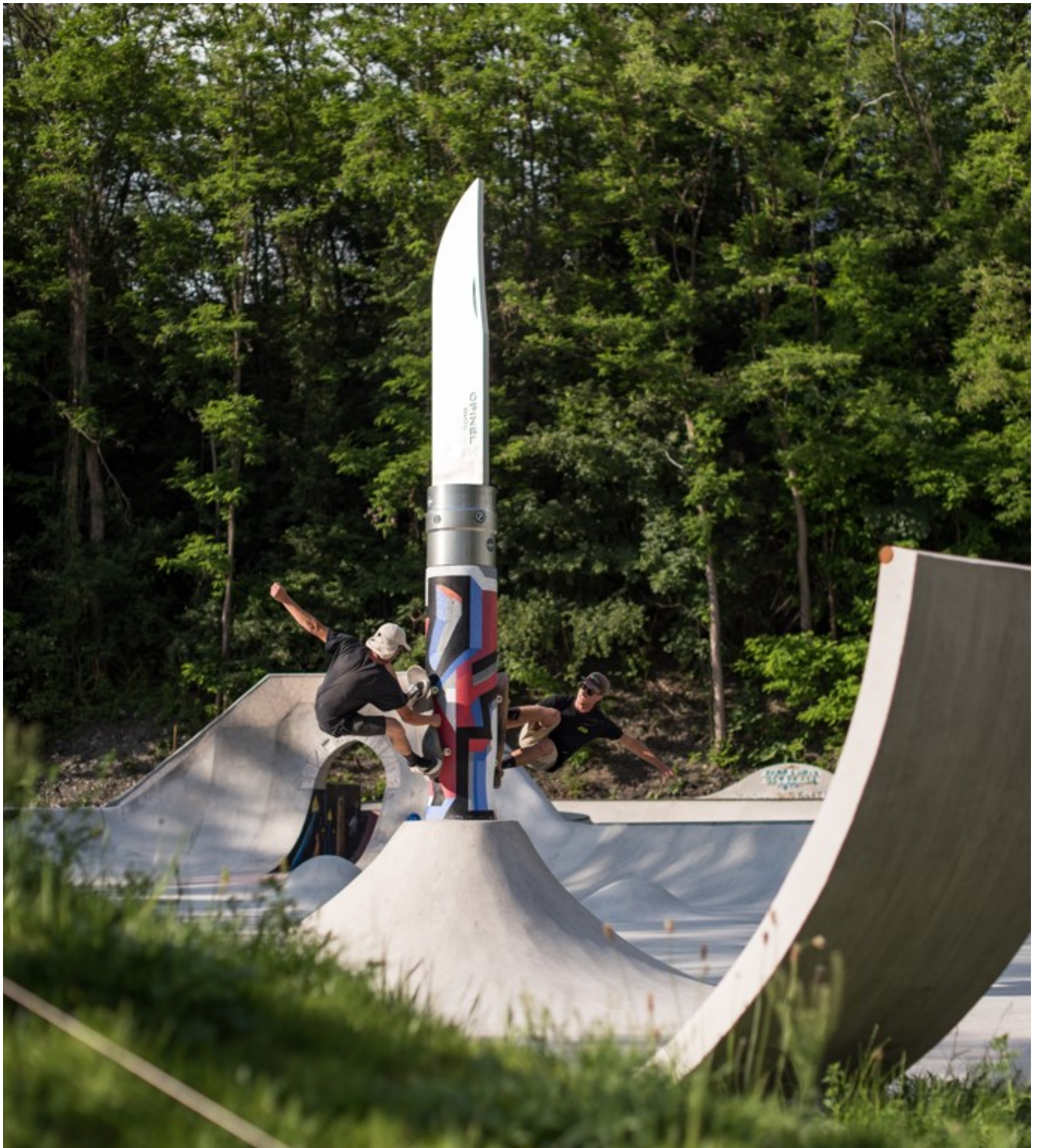
Le Volcano Opinel, une œuvre d'art skateable installée au sein du skatepark Versus.