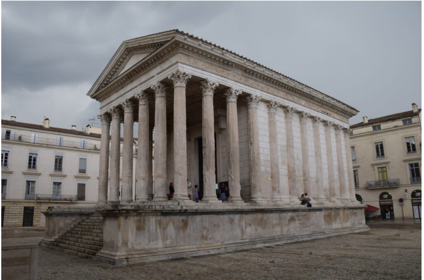
La Maison Carrée, candidate à l'Unesco.

Des visites autoguidées sont disponibles en son sein ainsi que des alcôves multimédias consacrés à l'histoire de la taumachie ou encore des gladiateurs.