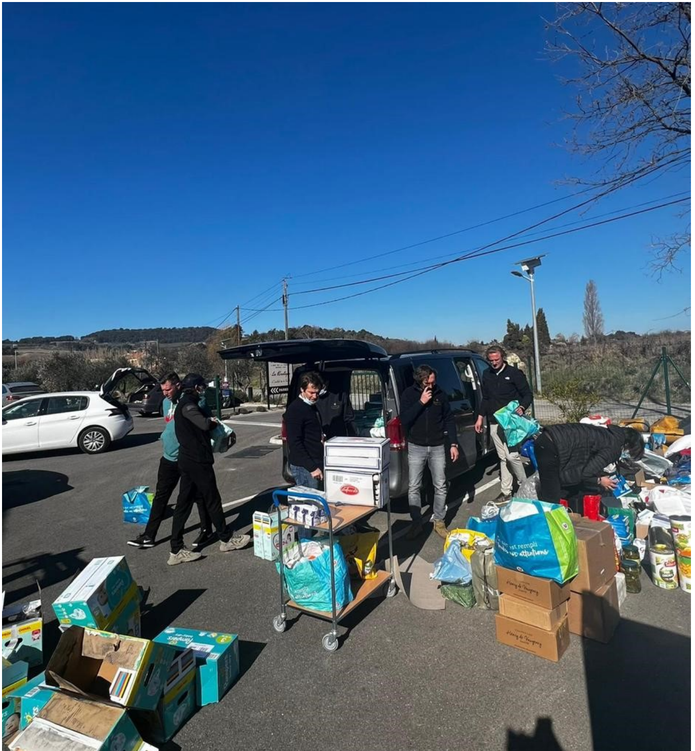
Les cartons s'accumulent.